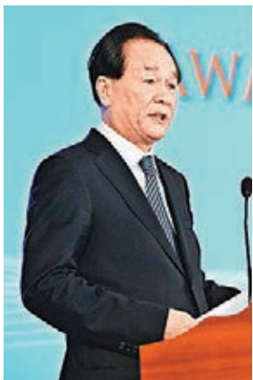
蔡名照在頒獎儀式上講話。

香港文匯報訊(記者 秦占國、羅洪嘯 北京報道)首屆世界媒體峰會全球新聞獎昨日在北京頒發,這是全球首個涵蓋全媒體形態、面向全球所有媒體的國際新聞獎項。1424件參賽作品來自138個國家和地區共450多個新聞機構,並從中評選出4個最終獲獎者。新華社社長蔡名照出席頒獎儀式並致辭。 世界媒體峰會全球新聞獎共有來自138個國家和地區450多個新聞機構的1424件作品參賽。專家委員會向終評委員會推薦了36件入圍作品。評選結果去年10月揭曉,共產生4個獲獎者和19個提名獎獲得者。半島媒體集團英文頻道「東方101」節目組獲得發展中國家優秀新聞團隊獎,《印度教徒報》塞納斯·帕拉古米獲得發展中國家優秀新聞從業人員獎,《今日美國報》的《大屠殺的背後:美國群死群傷惡性兇殺案件之鮮為人知的故事》獲得媒體創新獎,美國《環球郵報》的《變革中的緬甸》獲得新媒體報道獎。