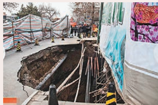
北京發生坍塌事故,曝露出私建的18米地下室。

香港文匯報訊 據中國廣播網報道,北京德勝門內大街日前發生坍塌事故,曝露出房主未經審批,偷挖18米深地下室,所幸事故無人傷亡。《北京日報》的微信公眾賬號「東張西望」昨日發文《這位人大代表,你賠我們的德內大街!》,指出德勝門內大街有關民宅的房主是江蘇徐州市人大代表李寶俊。媒體此前報道其身份為:徐州市人大代表、政協委員、海榮集團董事長。公開資料顯示,海榮集團成立於1995年,公司註冊資金一億元人民幣,在職員工800人,固定資產約20億元人民幣。