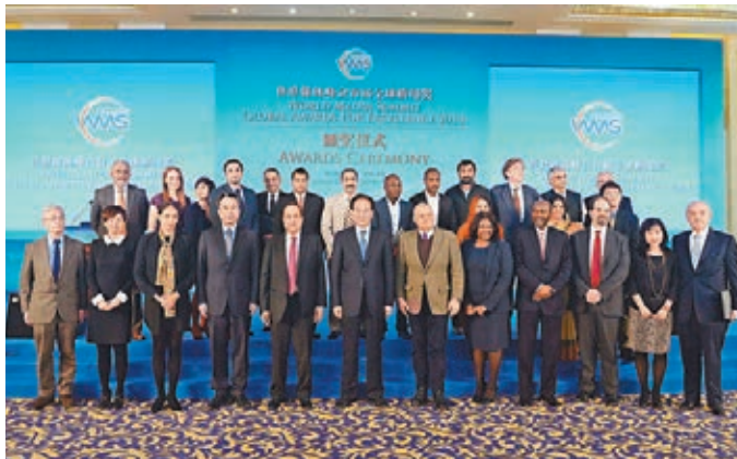
頒獎嘉賓與來自不同媒體的得獎者合影。