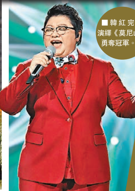
■韓紅完美演繹《莫尼山》勇奪冠軍。

絲上台獻花,兩人相擁後靚穎聲音哽咽,熱淚奪眶。歌畢後靚穎說,這位粉絲在2005年《超級女聲》比賽時,就在台下支持她。「我真的沒想到他們會出現在這裡,我很感動也很感謝。我只希望自己越來越好,我的夢想是階梯式的發展,走穩了這個台階才敢邁向下一個台階。在十年的時間,我真的非常謝謝一路支持我的粉絲們。」 最近張靚穎在《我是歌手3》面臨淘汰、選歌不當等質疑,張靚穎直言從未後悔,「自己一直都很任性,但任性不代表聽不到大家的聲音,也並不代表不在乎,只是因為熱愛音樂,所以更希望放寬自己,做更多的嘗試。」