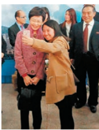
林鄭月娥與華大港生親密自拍。

林鄭月娥昨日還拜訪了泉州市市長鄭新聰，並赴「鐵觀音故鄉」安溪縣參觀茶園、探望港商投資的安溪鐵觀音集團。