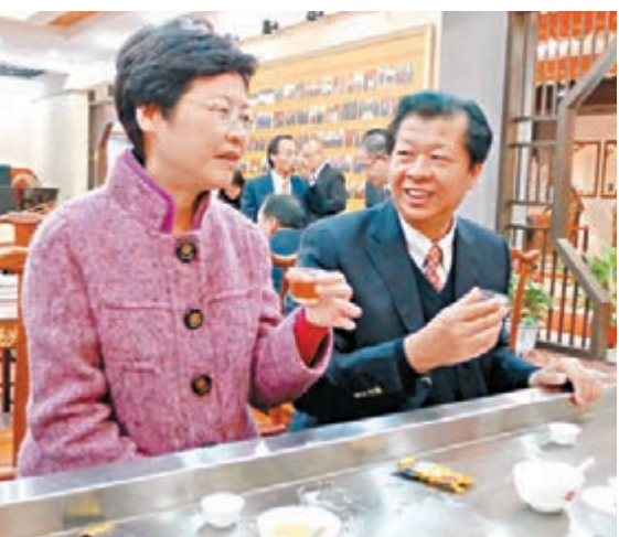
林鄭月娥在泉州市副市長陳榮洲的陪同下品嚐安溪鐵觀音。