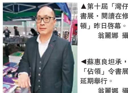
第十屆「灣仔書展·閱讀在修頓」昨日開幕。