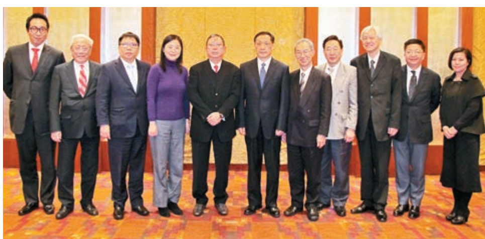
國家旅遊局局長李金早(中)會見港旅遊業訪京團。

香港文匯報訊(記者 文森)香港旅遊業暢旺，去年在「佔中」陰霾下仍錄得创新高突破6,000萬訪港旅客人次。然而，旅發局指雖然數字有增長，但「佔領」行動仍造成一定影響，其中個人遊旅客數目於10月份的增長明顯收窄至單位數字，長途、短途及新興市場的訪港旅客數目更不升反跌。旅發局未來會在多個短途客市場做宣傳，恢復香港的旅遊形象，又建議增加內地來港個人遊城市(見另稿)。旅發局亦計劃於今年10月或11月舉辦因「佔中」而胎死腹中的首屆「香港單車賽」，推廣單車文化。