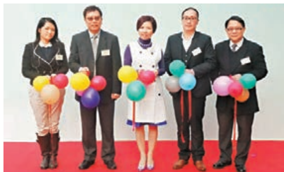
第十屆「灣仔書展·閱讀在修頓」昨日開幕。