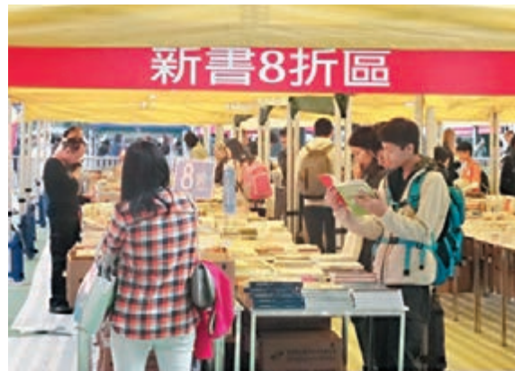
灣仔書展一連三天在修頓球場舉行，並設有新書8折區。