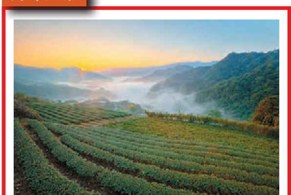
坪林茶園奪冠 新北市坪林區茶園以翡翠水庫集水區碧海與曙光美景奪冠。