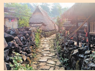
寨子裡院牆很矮，道路也窄。