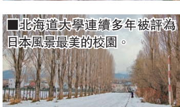
北海道大學連續多年被評為日本風景最美的校園。