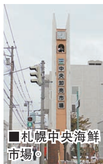
札幌中央海鮮市場

北海道大學出來不遠，便是中央海鮮市場。這裡是北海道最大的海鮮市場，每年有各種最為新鮮的海產發往日本各地及海外。更有許多海產餐廳將剛打撈的海鮮現場加工，為遊客們提供美味的海鮮宴。在北海道，最為有名的海鮮便是帝王蟹，而冬季正是帝王蟹上市的季节。從200-300米的冰冷海水中打撈出來的帝王蟹不僅個頭巨大，而且肉質鮮美，堪稱日本螃蟹之最。餐廳通常選擇煮熟的簡單烹飪方法，輔以佐料，讓食客盡情品嚐蟹肉的鮮美。如果想品嚐更多螃蟹的做法，可以到札幌市中心的蟹本家和蟹將軍。這裡的螃蟹宴琳琅滿目，能把螃蟹做成湯、丸子、刺身、輕炸等各種類型，讓食客大飽口福。