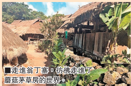
走進翁丁寨，彷彿走進了 蘑菇茅草房的世界。

距香港1600公里的雲南西 抱、小徑通幽、竹樓靜立又 部滄源縣，有一座山戀環 充滿自然靈氣的原始村 寨——翁丁寨。這裡保留着原始佤族 民居的建築風格和 佤族風土人情，是 迄今為止保存最為 完好的原始群居村 落，也被譽為「中 國最後一個原始部 落」。