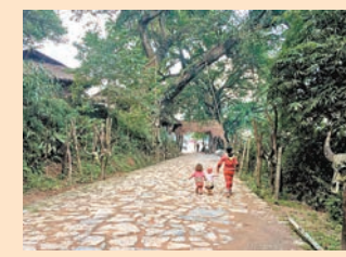
翁丁寨門前參天的大榕樹。