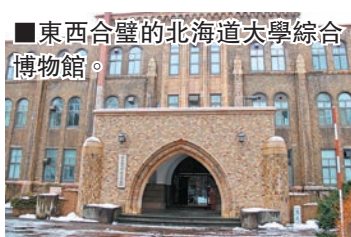
東西合璧的北海道大學綜合博物館。

大學建築東西合璧，目前仍完好地保存着幾座頗具歷史的明治時期建築。其中，多座博物館都對外開放，讓公眾們在欣賞歷史建築的同時，還得以很好地了解北海道的歷史和文化。由於位於市中心火車站附近，北海道大學交通便利。茶餘飯後來到校園內，在綠地、小溪、樹林、農場間漫步，不失為在大自然中放鬆身心靈的絕佳體驗。