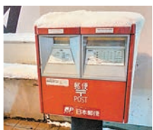
在北海道為自己寄一封青春的書信。