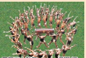
佤族木鼓舞

在寨口，熱情的佤族婦女敲起木鼓唱着佤族山歌迎接客人的到來。在佤王府，年邁的長者會斟一杯苦澀的烤茶，雖一言不發，但一個微笑足矣。在院門口，可愛的小姑娘幫家裡人促銷着的土特產，買一樣東西她就為大家唱一首歌。走在翁丁的每一處，感受到的都是一種自然與和諧，這與古寨的人有關。