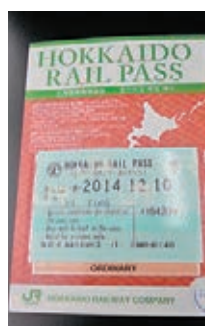
北海道鐵路周遊券

如果你是鐵道迷或者動漫迷，那麼來北海道體驗JR（日本鐵路）絕對是最為浪漫方便的選擇。火車沿着海岸線在皚皚雪原中穿梭是關於北海道的動漫中最為經典的畫面。在札幌到小樽的火車上，便能欣賞到這樣的風景，一邊是白雪覆蓋的森林，一邊則是蔚藍的大海，遠處的風景忽隱忽現。因此，乘火車絕對是欣賞北海道冬季美景的最佳方式。