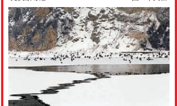
納帕海雪景如畫 鳥兒在雲南香格里拉縣的納帕海湖面上嬉戲。 圖：新華社