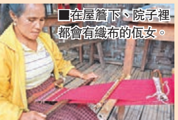
在屋簷下、院子裡 都會有織布的佤女。