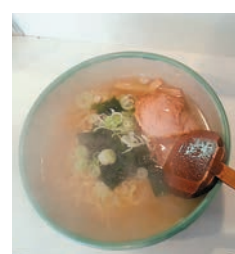
招牌函館鹽拉麵 清淡新鮮，鹽味唇齒留香。

此外，北海道有「拉麵王國」的美譽，各種做法的拉麵讓人目不暇接，其中簡單清爽的函館鹽拉麵讓人品過難忘。就在北海道南部港口城市函館的海鮮市場，有一家日本著名樂隊Glay推薦的函館拉麵店，函館出身的Glay每次回鄉都要來這家店回味鹽拉麵的難忘滋味。招牌的鹽拉麵用骨湯熬製而成，幾片豚肉，一把蔥花，加入函館特產鹽，清淡新鮮，鹽味唇齒留香。