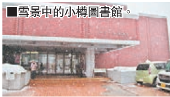
雪景中的小樽圖書館。