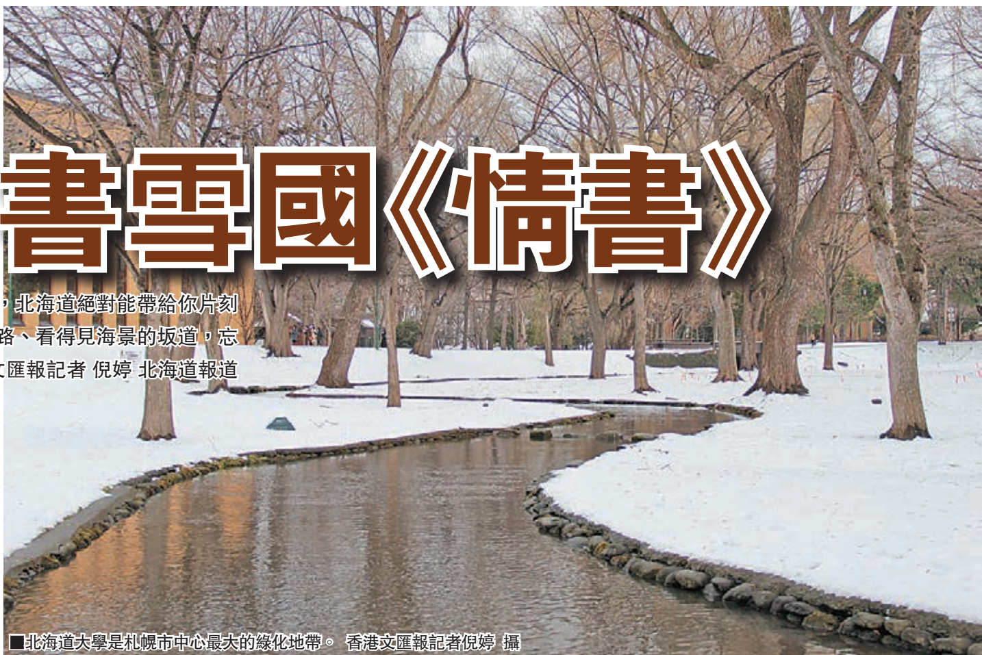
北海道大學是札幌市中心最大的綠化地帶。

日本著名導演岩井俊二的代表作《情書》讓小樽這座一度落寞的北海道港口城市名聲大噪，不少影迷紛紛來到這裡朝聖，尋訪主角藤井樹的痕跡。