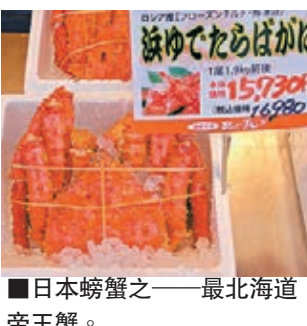
日本螃蟹之一——最北海道帝王蟹。