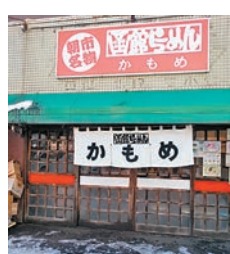
日本著名樂隊Glay推薦的函館拉麵店。