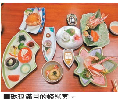
琳琅滿目的螃蟹宴。