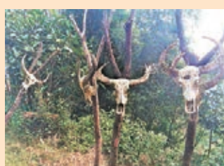
隨處可見的牛頭骷髏。

進入寨子，在茅草木樁搭建的長廊兩旁的樹上，在村口的大榕樹幹上，在鄰里之間小道的籬笆邊，隨處可見掛滿着牛頭骷髏。甚至在村邊的一棵大榕樹旁，插了很多頂端是用竹子編成漏斗形狀的竹竿，竿旁的牌子上赫然寫着「人頭樁」，不明其意的人是會感覺一股神秘、陰森的氣氛。其實歷史上，佤族人就有剽牛和獵人頭的習俗，因此外界一直對阿佤山充滿着好奇，牛是雲南佤族的吉祥物，祭牛頭則表示對神靈的虔誠，牛頭越多表明祭祀的次數越多，也表明這個家族更富有，更興旺。而佤族的獵人頭血祭是祭木鼓，每當天災人禍或春耕播種的時候，佤山村寨就要祭他們的通天神器——木鼓，而祭木鼓必須獵人頭，等祭祀完後，便把人頭安放在人頭樁上。直到1957年，佤族獵人頭習俗才被廢除。