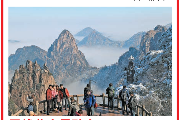
雪後黃山景醉人 在黃山風景區拍攝的雪後壯美風景。