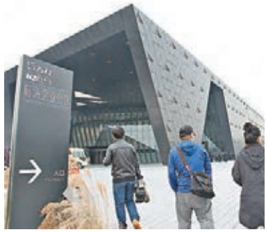
■前海的發展正在提速。

香港文匯報訊(記者 李望賢 深圳報導)首屆前海地下空間與城市發展研討會日前召開,未來前海地下空間開發將達到660萬平方米,這裡將建成亞洲最大的交通樞紐,能接駁10餘條地鐵和深港西部快速通道,並形成地下快速路、地下環路、地下車庫三級地下車行系統。