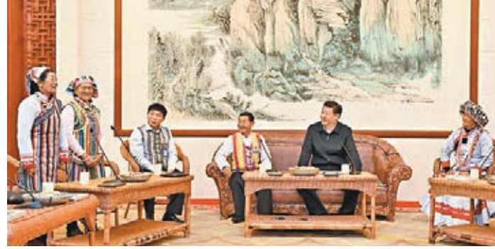
■兩獨龍族女子當面向習近平唱感恩歌。

(下同),較去年增長16.2%,而同期內地增長僅為2.3%。相關人士認為,雲南與東盟的經濟聯繫越來越緊密,在整個外貿中佔比越來越大。2014年,雲南與東盟貿易額879.3億元,增長30.5%,佔該省外貿總額的48.3%,其中與雲南接壤的緬甸、越南、老撾貿易額分別增長67.4%、16.5%和30.7%,是該省與東盟的前三大貿易夥伴。