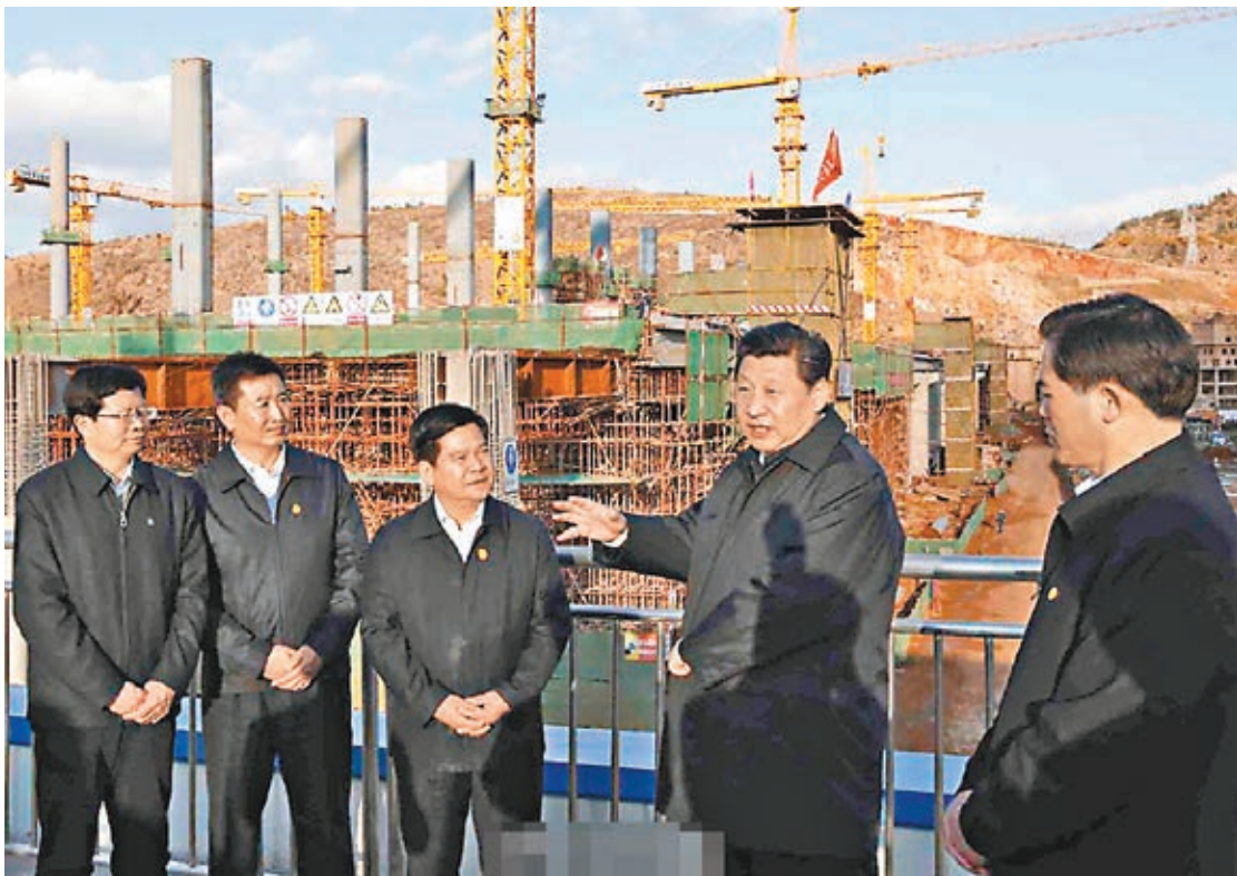
■習近平考察在建的昆明火車南站。 網上圖片

習近平20日前往昆明火車南站建設地盤,遠眺塔吊林立,一片忙碌景象。習近平聽取了有關匯報後說,千里之行,始於足下,關鍵還是要把我們自己的事情做好,把「接口」做好,才能實現互聯互通。