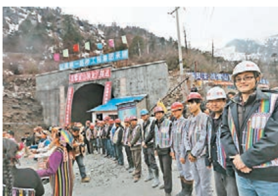
■獨龍江公路隧道貫通時的情形。 本報雲南傳真

溪、由磨憨口岸出境,經過老撾,到泰國、馬來西亞的泛亞鐵路中線;從昆明經瑞麗到緬甸,直達印度洋的泛亞鐵路西線;從昆明經保山、騰沖出境通往緬甸密支那、孟加拉國、印度雷多的泛亞鐵路北線等4條國際鐵路。