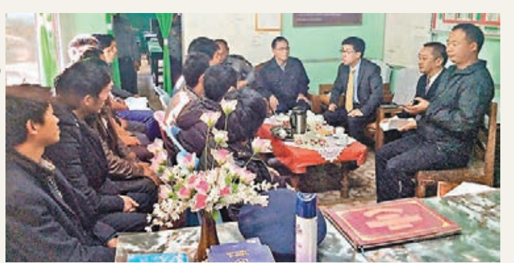
■中國駐緬使領館領官員赴緬甸至莫警察局看守所探視被關押的中國公民。

香港文匯報訊 中國外交部發言人華春瑩昨日在例行記者會上證實,目前共有155名中國公民在緬甸因非法伐木被緬方抓扣,中方敦促緬方從人道主義出發,善待上述人員,保障他們的合法權益。