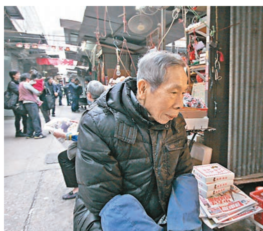
鄭伯指曾聽到一響類似爆炸聲響。