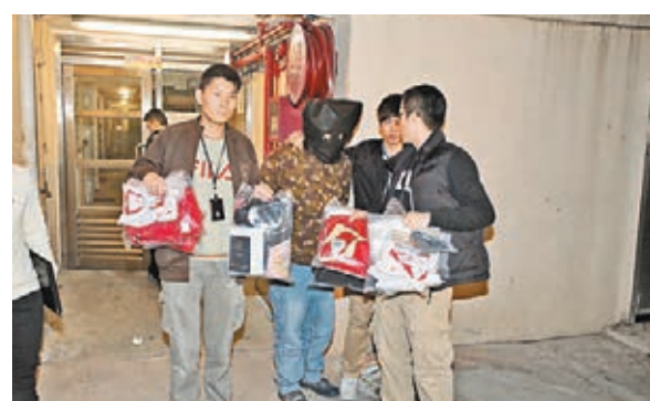
專在機場巴士偷竊空姐行李慣犯被押返愛民邨家中搜屋。

懷疑亦是梁所為。前晚深夜11時，探員將疑犯押返愛民邨住所搜查，起回多件空姐制服及多個空姐名牌。疑犯又涉嫌勒索及盜竊。去年12月17日，一名23歲空姐乘機場巴士期間被人偷走行李，翌日接獲可疑短訊勒索金錢，警方相信亦是梁所為。另上月19日，梁仍在職期間，在候機室趁俄羅斯女客小睡時，偷去其放在手推車上的手袋。事後，警方在男廁門外尋回手袋，但袋中600美元及3,000元盧布盡失，經翻查閉路電視鎖定疑犯，其後將他拘捕，起回部分贖款。