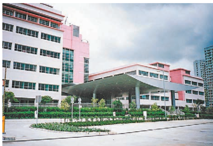
醫院管理局昨日發表最新一期「手術成效監察計劃」，比較本港17間公立醫院的外科手術成效，發現北區醫院在緊急手術方面表現最差，實際死亡人數較預期多出24%。圖為北區醫院。

至於連續5年俱在緊急及非緊急手術表現最差的屯門醫院，今年則俱被評分合格。該院於2013至2014年度分別有5宗及31宗預約及緊急手術死亡個案，兩項數據較前一年度大幅下跌分別60%及50%，脫離表現遜色的行列。醫管局外科中央委員會主席王志衛解釋，一向不太重視排名，因為少一個病人去世，排名就會輕易改變。