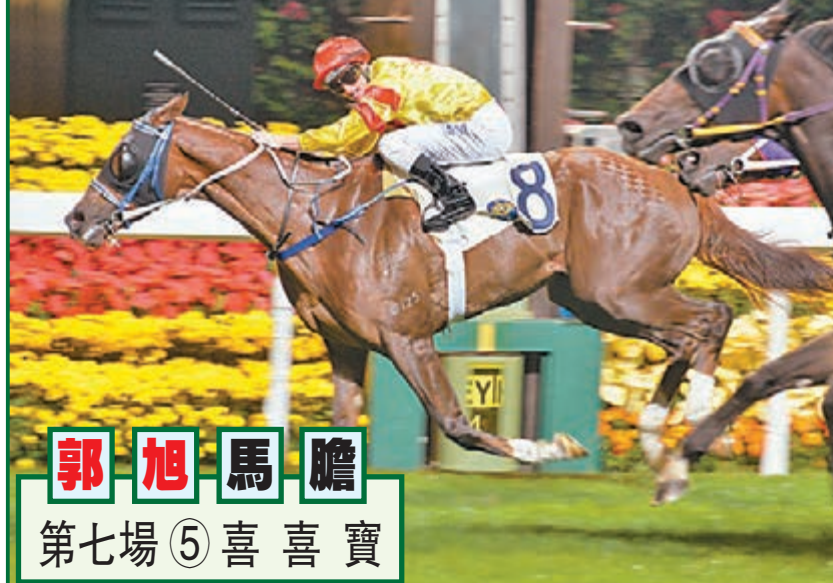
郭旭馬膽 第七場 ⑤喜喜寶

今晚跑馬地舉行八場賽事，採用C跑道並向後移欄角逐，由於內欄向外移，比賽空間狹窄，彎角弧度十分急銳，故此對於排內檔而具備前速的馬，處境最為有利進取，相反轉彎加速發力形勢非常輪蝕，揀馬時可秤先排內欄及前置馬。頭場開跑時間為晚上七時十五分，現將各場心水提供如下。