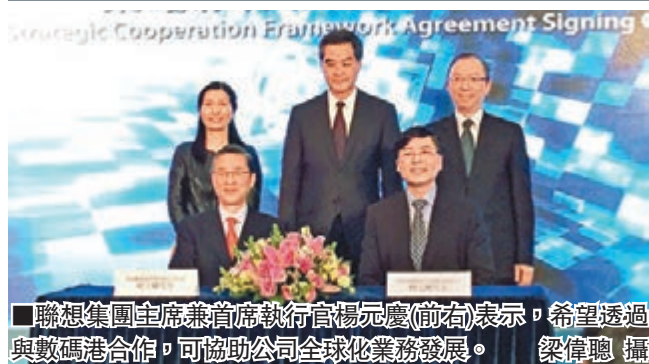
聯想集團主席兼首席執行官楊元慶(前右)表示,希望透過與數碼港合作,可協助公司全球化業務發展。

香港文匯報訊(記者 梁偉聰)聯想集團(0992)昨日與數碼港簽署戰略夥伴框架協議,於數碼港建立亞太區首個雲服務及產品研發中心,主席兼首席執行官楊元慶表示,希望是次合作,可協助公司全球化業務發展,亦可扶持科技初創企業,支持年輕人創業。行政長官梁振英致辭時指,希望立法會少數議員為大學生的前途着想,不要再「拉布」,通過「創新及科技局」的撥款。楊元慶表示,研發中心的重點將圍繞「大數