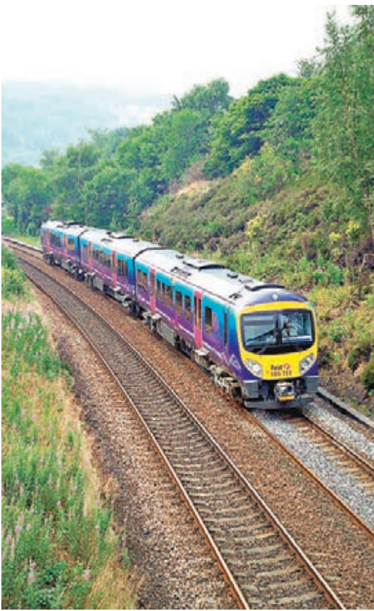
英國 Eversholt Rail Group 的鐵路車輛租賃。

繼去年7月收購加拿大機場外圍停車場服務公司 Park 'N Fly, 及去年10月收購澳洲天然氣配氣商 Envestra (已易名為 Australian Gas Networks) 後,是次交易乃長建於過去6個月的第三項收購。李澤鉅表示,長建將繼續於全球物色收購機遇,以進一步擴展及壯大集團的投資組合。