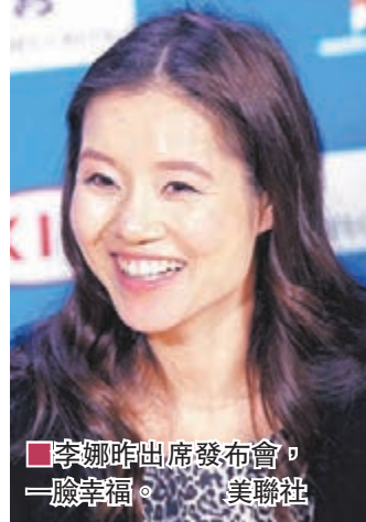
李娜昨出席發布會，一臉幸福。