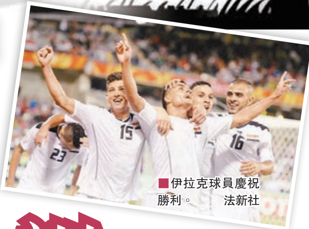
伊拉克球員慶祝勝利。