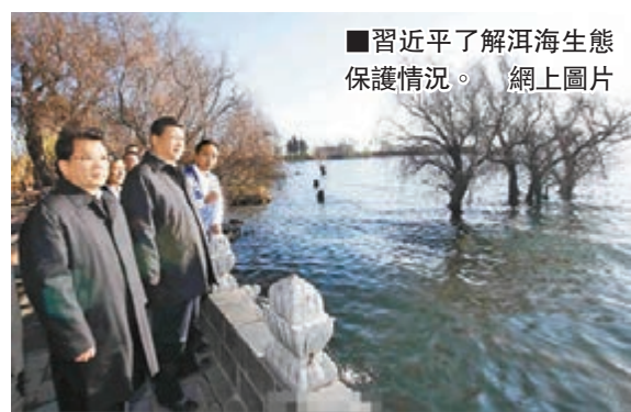
■習近平了解洱海生態保護情況。網上圖片

車、拖拉機、低速汽車全系列汽車生產資質為一體。在緬甸、越南、老撾、柬埔寨、印度等國家建有銷售辦事處，與東南亞、南亞、非洲等國建立了良好的貿易往來。去年完成工業總產值122億元人民幣，同比增長22%。