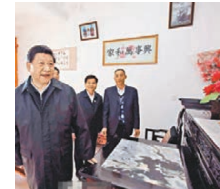
■習近平在村民李德昌家參觀。網上圖片