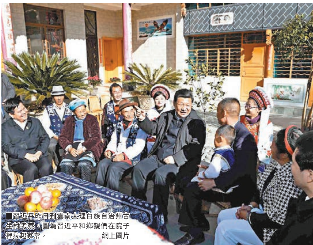
■習近平昨日到雲南大理白族自治州古生村考察。圖為習近平和鄉親們在院子裡拉家常。網上圖片

習近平當天在古生村以洱海背景與當地官員合影後說：「立此存照，過幾年再來，希望水更乾淨清澈。」他叮囑當地官員一定要改善好洱海水質。