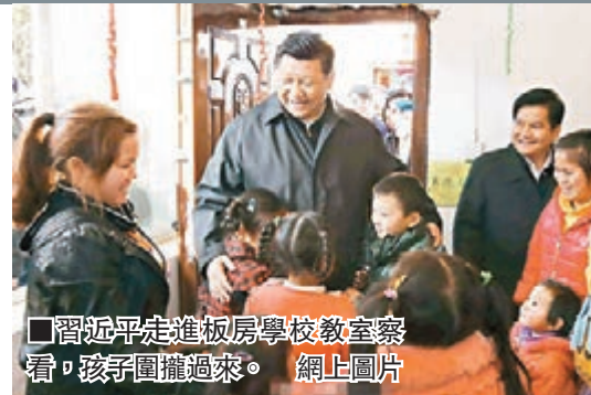
■習近平走進板房學校教室察看，孩子圍攏過來。