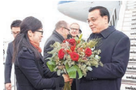
李克強抵達瑞士蘇黎世,出席達沃斯世界經濟論壇年會並對瑞士進行工作訪問。

結束論壇年會活動後,李克強將對瑞士進行工作訪問。他將同瑞士聯邦主席索馬魯加等瑞方領導人在達沃斯舉行雙邊會談。中瑞有望在金融、經貿、科研、食品與藥品及人文等多個領域達成重要共識,宣佈一批新的合作成果。