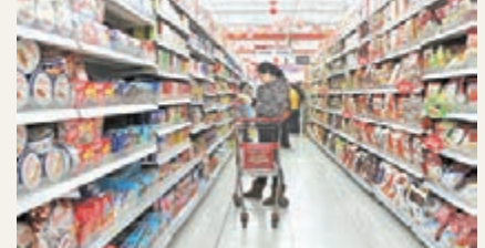
中國2014年12月社會消費品零售同比增長11.5%,創四個月新高。圖為福州民眾在超市購物。資料圖片

GDP增長的貢獻率為51.2%,比上年提高3.0個百分點。2014年全年,中國電商業務蓬勃發展,全國網上零售額27,898億元,同比增長49.7%,相當於全年社會消費品零售總額的10.6%。