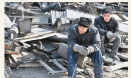
中國去年堅尼系數為0.469,自2009年來連續第6年下降。圖為外來務工人員在一廢舊品回收站等待生意。

化住戶調查,2014年全國居民人均可支配收入20,167元人民幣,扣除價格因素實際增長8.0%,其中城鎮居民人均可支配收入實際增長6.8%,2013年以來持續低於經濟增速;農村居民人均可支配收入實際增長9.2%,高於經濟增速。