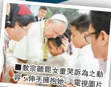
教宗聽罷女童哭訴為之動容，伸手擁抱她。電視圖片

瑞郎急漲，令當地本已高企的物價更見高昂，資料統計網站Numbeo資料顯示，2015年全球生活花費最高的國家中，瑞士再次排名第一，其次是挪威、物產短缺的委內瑞拉、冰島和丹麥。瑞士物價足足比紐約貴26%，比第2位的挪威高出8個百分點。Numbeo根據各國消費者物價指數與紐約相比後，計算出全球生活花費最高的國家。亞洲國家中，以排名第8的新加坡最高，物價比紐約低6.39%。