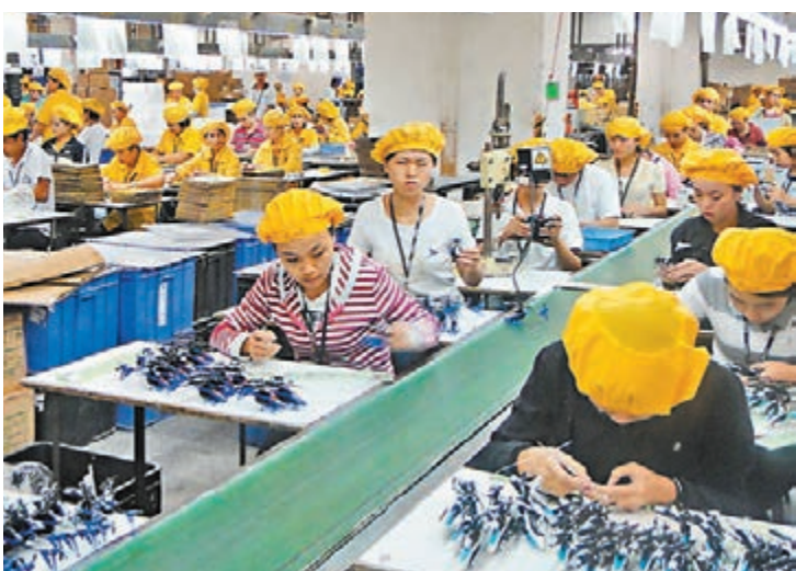
完善涉港澳台法制工作, 保障和促進四地合作和交流, 讓港澳台同胞真正感受到合作利益得到了規範和保護, 放心回來投資和發展。

馬興瑞表示, 將依法規範和推動粵港澳台的交流和合作。他在回答記者提問時解釋, 廣東的地理位置比較特殊, 毗鄰港澳, 同時有很多港澳同胞在廣東發展, 在中央有關政策指導下, 尤其是CEPA框架對經貿往來的促進更加明顯, 廣東自貿區政策落地的利好, 可以讓廣東在經貿、科技、文化、僑務等方面都能在雙邊和多邊關係上加強和