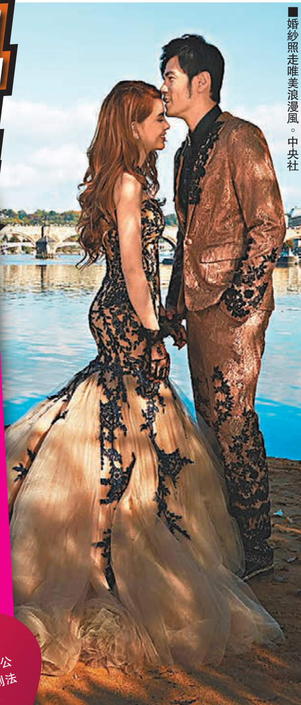
婚紗照走唯美浪漫風。