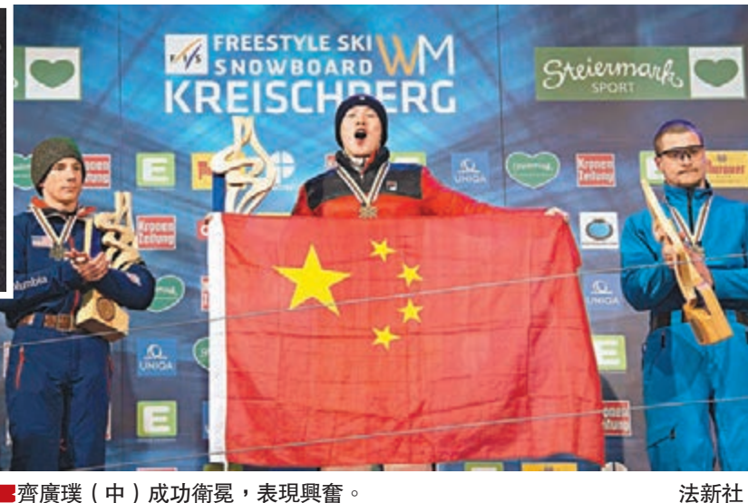
齊廣璞(中)成功衛冕,表現興奮。