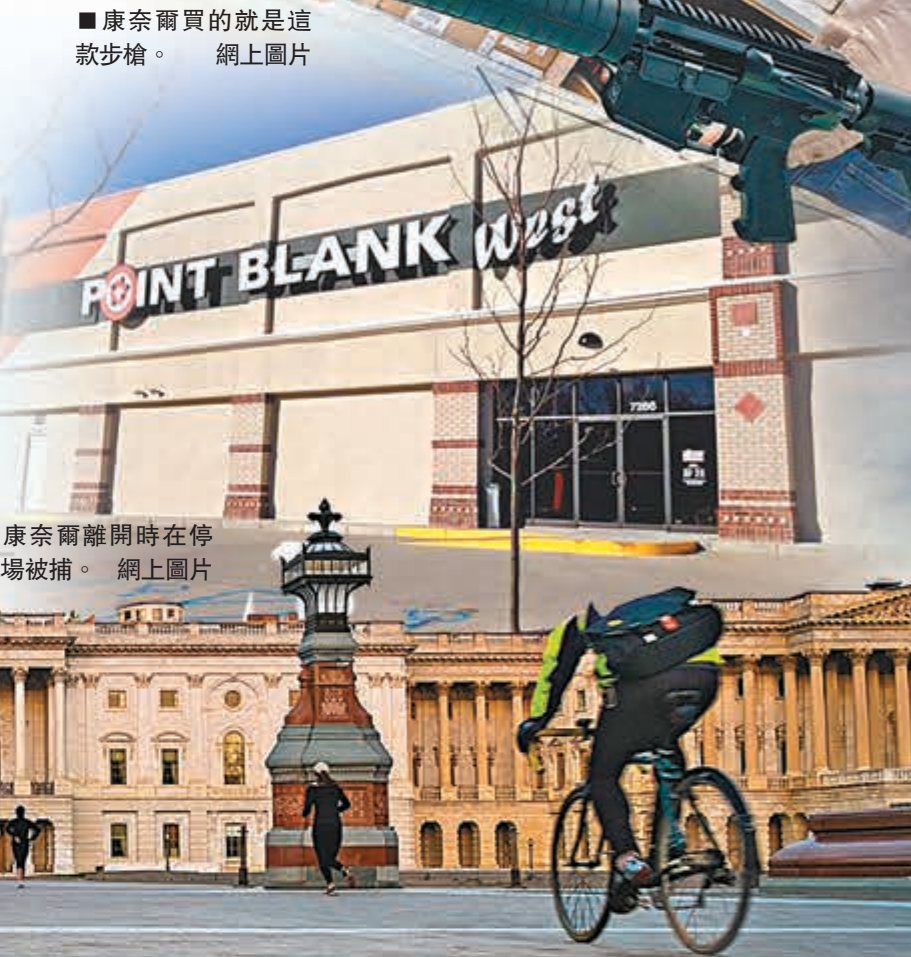
康奈爾買的就是這款步槍。網上圖片