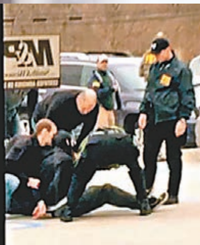
康奈爾前日遭警方制服後拘捕。