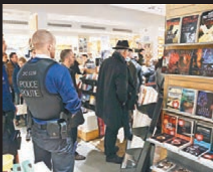
比利時一間書店顧客排隊買《查理周刊》，警方在旁戒備。

新一期《查理》前日出版後旋即售罄，在eBay網站更炒至1.5萬歐元(約13.5萬港元)天價，無國界記者斥責「發死人財」行為不當，eBay前晚亦宣布禁