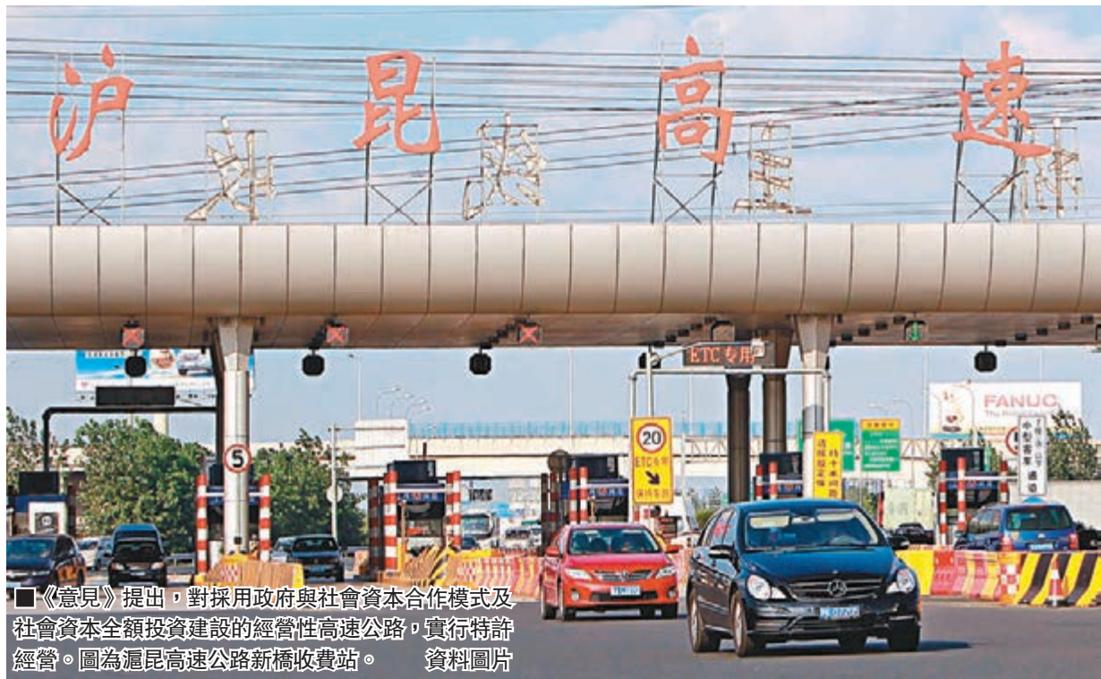
《意見》提出,對採用政府與社會資本合作模式及社會資本全額投資建設的經營性高速公路,實行特許經營。圖為滬昆高速公路新橋收費站。

對於收費公路問題,《意見》提出「大膽破冰,深化公路管理體制改革」,「政府投資的收費公路實行收支兩條線」。立足中國基本國情和社會多元化的出行需求,按照使用者付費、債務風險可控等原則,完善收費