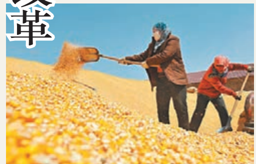
2015中央一號文件預料仍聚焦三農議題。資料圖片

中央一號文件指中國共產黨中央每年發的第一份文件。這份文件在國家全年度工作中具有綱領性和指導性的地位。2014年中央一號文件主題是「關於全面深化農村改革加快推進農業現代化的若干意見」,全面定調2014年及今後一個時期農業農村工作。