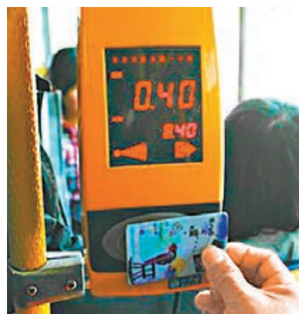
交通部研究制定智慧交通發展框架,實現ETC、公共交通一卡通等全國聯網。

據中新網報道,《意見》要求研究制定智慧交通發展框架。促進基礎設施、信息系統等互聯互通,實現ETC、公共交通一卡通等全國聯網。推動交通運輸行業數據的開放共享和安全應用,充分利用社會力量和市場機制推進智慧交通建設,推進新一代互聯網、物聯網、大數據、「北斗」衛星導航等技術裝備在交通運輸領域的應用。建立健全交通運輸領域科研設施和儀器設備開放運行機制。