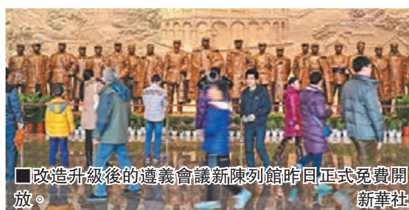
改造升級後的遵義會議新陳列館昨日正式免費對外開放。

劉奇葆強調,要發揚紅色傳統、傳承紅色基因,用革命文化傳播和滋養社會主義核心價值觀。要弘揚獨立自主、改革創新精神,主動適應和引領新常態,奮力開拓中國特色社會主義更為廣闊的發展前景。要堅持全面從嚴治黨,嚴守政治紀律和政治規矩,保持黨的先進性和純潔性,使黨始終走在時代前列、引領發展進步。