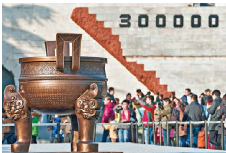
大批民眾前往侵華日軍南京大屠殺遇難同胞紀念館悼念30萬遇難同胞。圖為民眾參觀國家公祭鼎。

人數為「30萬人」的發言，已向中方表達有關數字「不妥當」，事後亦提出交涉。報導指，事件沒有對外公開，相信是考慮到習近平去年11月曾與首相安倍晉三會談，有外務省人士指出，有必要堅持日方的立場。 在北京，外交部發言人洪磊指出，南京大屠殺是日本軍國主義在侵華戰爭中犯下的殘暴罪行，鐵證如山，早有定論。任何企圖為侵略歷史翻案的言行都只會損害日本的國際誠信。中方敦促日方正視態度，誠實履行正視和反省侵略歷史的承諾。