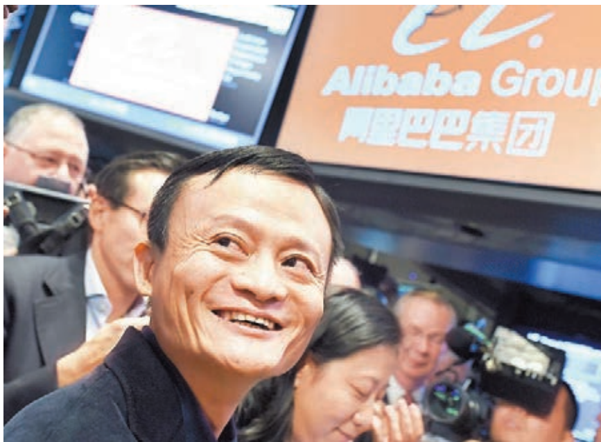
■成功追逐美國夢的阿里巴巴,向外開的野心未見休止,最新的動作傳斥資5.5億美元入股印度在線支付公司One97 Communications。

巴集團與仁川市商議,聯合投資9.23億美元,雙方注資半數,在韓國第二大港口城市仁川興建100萬平方米的「阿里巴城」,包括大型購物商場、酒店、物流中心、文化設施等。消息更指雙方正協商有關地皮的問題。