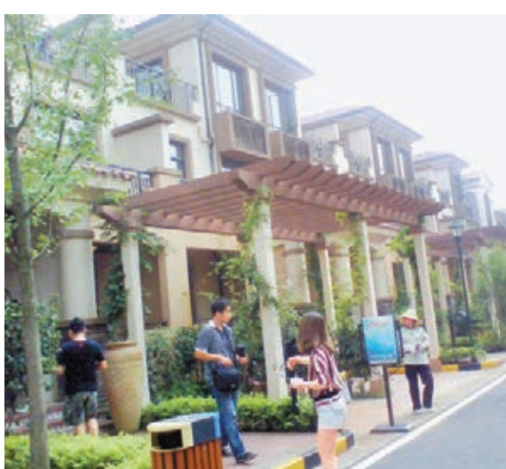
■圖為佳兆業在長沙開發的水岸新都。

述,該公司媒體部門員工昨天在電子郵件中表示抱歉,稱他們不清楚5億美元、2020年到期的美元債券應付利息是否已經支付,只有等待新公告。