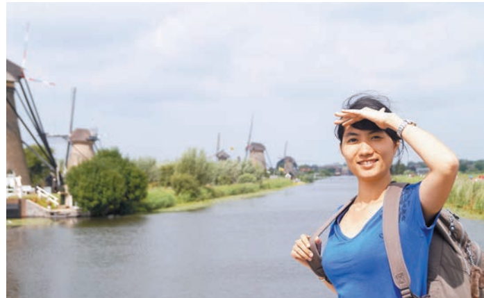
筆者去年暑假於荷蘭及德國交流，體會當地明媚風光。筆者供圖