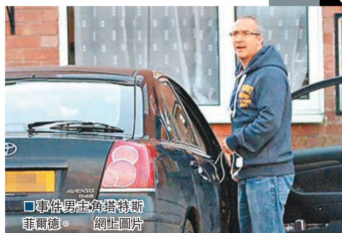
事件男主角塔特斯菲爾德。