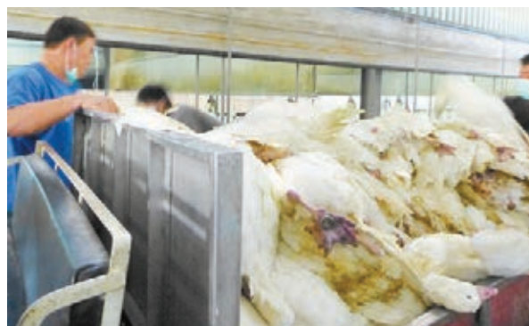
嘉義業者運載成車的鵝屍。