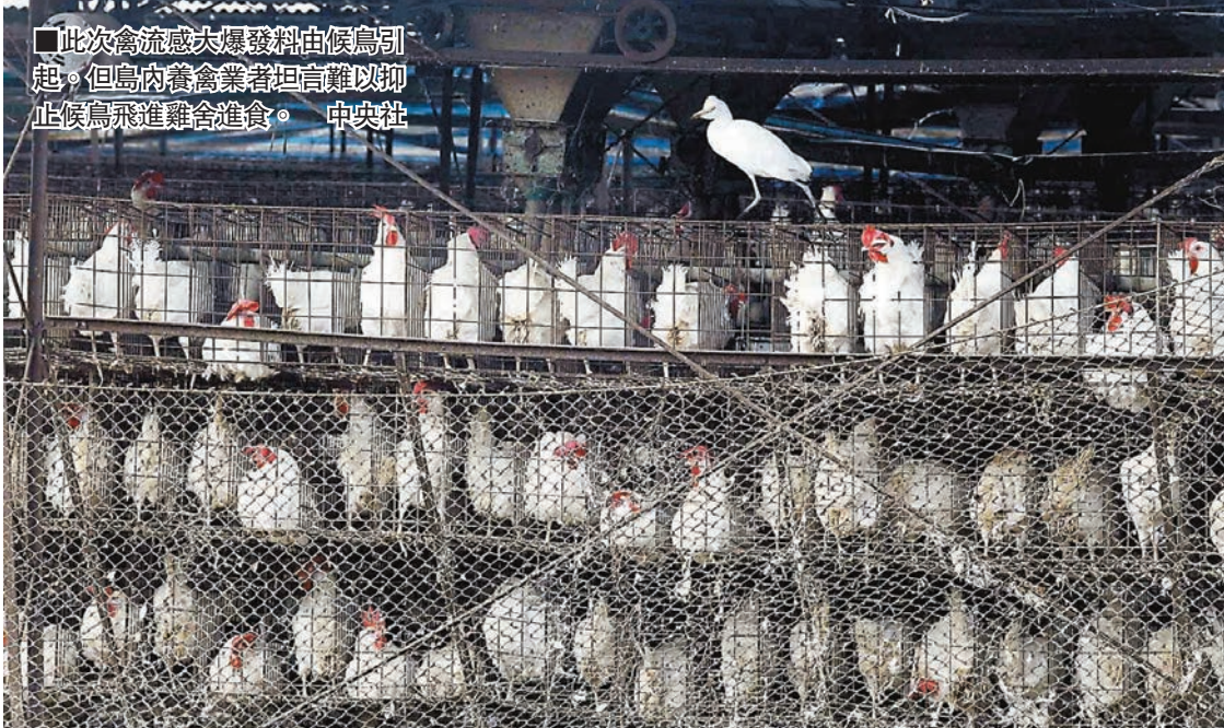
此次禽流大爆發料由候鳥引起。但島內養禽業者坦言難以抑止候鳥飛進雞舍進食。中央社

對於島內禽流疫情由向北擴散的趨勢，新北市政府昨日緊急召開禽流防疫緊急應變會議，要求將原應變機制提升為防疫中心，整合跨局處展開防疫工作，確保新北市市民禽安全。台北市昨日禁止民眾在公園餵食禽鳥，違者最高可罰6000元新台幣。針對禽流疫情風暴，引發台灣市民對市售雞蛋的安全疑慮，台灣3家快餐業龍頭麥當勞、肯德基及Burger King都表示，目前已知爆發禽流疫情的雞場，都不是他們的供應商，但會密切注意後續發展。