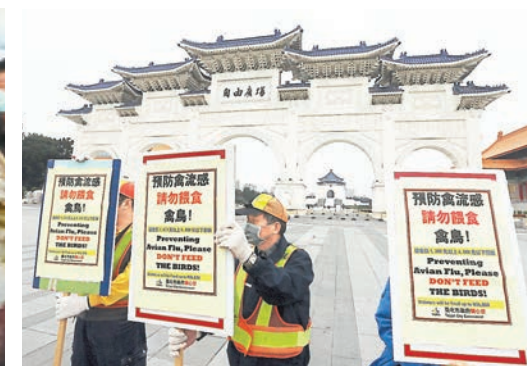
台北禁止民眾餵飼禽鳥。