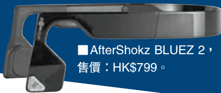
AfterShokz BLUEZ 2，售價：HK$799。

BLUEZ 2 除採用更簡約美觀的設計外，革新得人體工學設計讓佩戴者的負擔減至最低，加入全新的快拆鬆緊帶，提供良好的頭部支撐，裝拆更快捷方便，使用時亦更舒適。電池及按鍵分佈於左右兩邊，均衡重力，不再擔心重心向後，運動時佩戴更穩固，同時重量減少 20%。將所有按鍵前置，輕鬆抬起右手便可調校音量，操作更簡單方便。而且，它採用納米塗層和防水塑膠墊片，令汗水難以進入耳機，並通過 4 小時汗水澆淋測試，特別適合運動時使用。