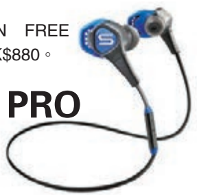
SOUL RUN FREE PRO，售價：HK$880。

音響品牌 SOUL 推出全新運動耳機 RUN FREE PRO，其透過高質藍牙 V4.0+ 作傳送，其內置 Apt-X 高質量立體環迴解碼器，加上自動配對模式，配對一次後，只需按下中心按鈕 3 秒，耳機即會與手機或音樂設備自動配對，讓你及時享受悅音。這更是世界上首款採用可更換式耳鎖安全系統的耳機，其精密的設計和不同尺寸的耳鎖或耳塞選擇保證耳機舒適貼耳，使你不論在任何動態下，就算進行劇烈運動時，都能讓耳機緊扣着雙耳，讓你盡情享受強勁的音樂節拍。