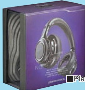
Plantronics BackBeat PRO，售價：HK$1,998。

耳機配備藍牙 4.0 技術，是品牌首款支援 Class 1 藍牙裝置的耳機，能於 100 米內播放高質素的立體聲音樂，是一般藍牙耳機的 10 倍距離；即便與 Class II 裝置配合使用，也無損它的一級水準。無線的設計，令用家毋須受電線困擾，無論到哪裡，都能方便地聆聽音樂。此外，耳機亦首次配備 aptX Low Latency 技術，只有 32 毫秒(ms) 的超低延遲率，和 aptX 裝置配合使用，給予你卓越的動態音效。BackBeat PRO 亦是品牌首部 BackBeat 系列耳機備有 multi-point 多點接駁功能，令耳機能同時連接 2 部藍牙裝置，如大家可同時接駁智能手機及智能平板電腦即可隨時轉換。連接技術更支援 NFC，只需以手機輕拍耳筒，便能立刻連接。