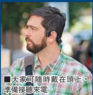
大家可隨時戴在頭上，準備接聽來電。

來自美國的 AfterShokz 骨傳導藍牙耳機 BLUEZ 系列，去年推出市場取得多個創新科技獎項，大受歡迎，當中不少熱愛運動的用家及常於戶外工作的朋友，更盛讚 BLUEZ 既方便又安全。BLUEZ 2 繼續採用品牌專利的 OpenFit 設計，以骨傳導技術將聲音信號直接傳遞至顱骨，通過骨路進入聽覺神經。開放雙耳不影響正常聽覺，可以一邊聽音樂同時與其他人交流之餘，更能於使用耳機時對周圍的交通情況或聲音作出反應。由於骨傳導耳機不用佩戴在耳朵裡面，減低因長時間封閉耳道而滋生細菌的機會，亦不會因長時間佩戴而令耳朵不適。