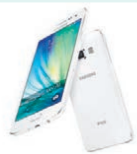
Samsung GALAXY A5 售價：HK$3,298 (GALAXY A5)；HK$2,498 (GALAXY A3)

除了擁有時尚而輕巧的設計，GALAXY A5 及 A3 均支援雙卡雙待功能，並兼容內地與香港 4G 及 3G 網絡 (5 模 17 頻)，以及支援 LTE Cat 4 制式以提供高達 150 Mbps 的下載速度及極速多媒體串流，同時採用 1.2GHz 四核心處理器，大大提升多作業的流暢度，以及版面切換和瀏覽網頁的速度。此外，兩部手機的前置相機鏡頭高達 500 萬像素，並內設玩味十足的智能自拍功能，配備 106 度廣角自拍模式，使大家輕鬆與親友拍攝出高質素的自拍相片。