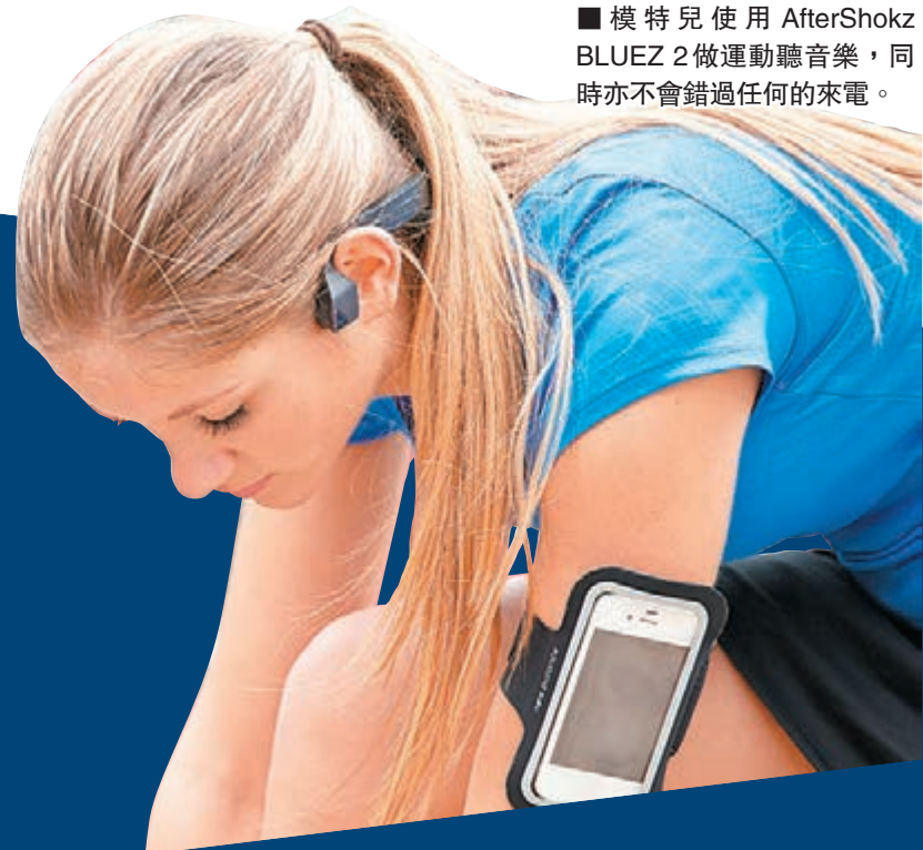
模特兒使用 AfterShokz BLUEZ 2 做運動聽音樂，同時亦不會錯過任何的來電。

自藍牙技術普及後的十多年來，它無疑為我們的生活帶來便捷，當中最為人熟悉的藍牙耳機也隨着市場需求而作出不斷的演變。加上，用家的生活習慣隨着智能通訊設備的發展而產生很大的變化，所以無論在耳機設計和功能上，不少品牌也花上極大的創意和心思，針對聽音樂或做運動，甚至配合時尚感而推出多款的藍牙耳機，務求迎合市場的需要，令用家在聽音樂或做運動時，都可以隨意接聽朋友的來電。 文、攝(部分)：JM