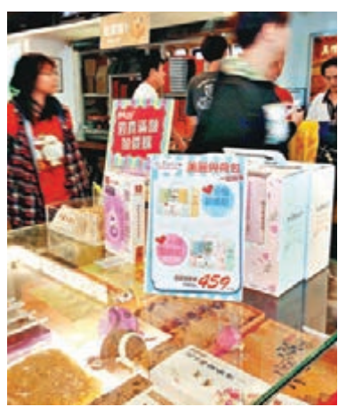
■島內鳳梨酥名店賣起了面膜。中央社

遷徙可能是散布病毒的原因。感染H5N8的鴨、鵝，會出現發燒、流鼻水。感染低病原型就像輕微感冒，不會致死；高病原則有如重感冒，致死率高。專家建議，禽流感病毒不耐熱，一般的烹煮過程（每部分均加熱至攝氏70度以上）即可使禽流感病毒去活性，食用雞蛋或雞鴨鵝等禽肉時，最好煮熟再吃，煮蛋時需將蛋白與蛋黃煮熟凝固狀再吃。中央社