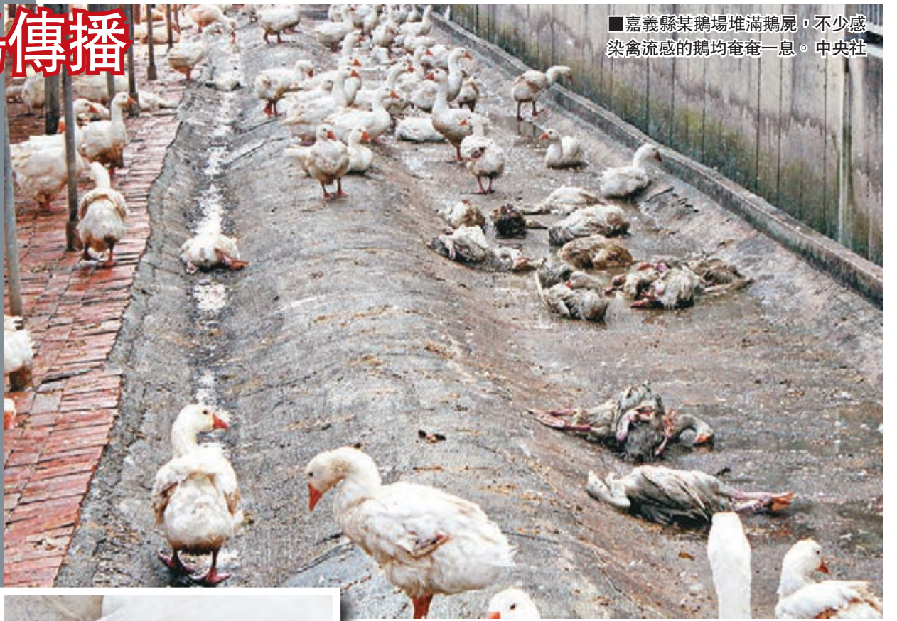
■嘉義縣某鵝場堆滿鵝屍，不少感染禽流感的鵝均奄奄一息。中央社

香港文匯報訊 繼屏東縣雞隻爆發H5N2高病原禽流感，當地撲殺12萬雞隻後，台灣禽流感持續擴大。雲林、嘉義、屏東連日有十多個養禽場爆發鴨鵝異常死亡，產蛋率下降。其中嘉義一處養鵝場死亡率高達七成，滿地都是倒在地上奄奄一息的鵝，並堆滿一袋一袋鵝屍。據中新社報道，台灣「農委會」昨日宣佈，嘉義種鵝樣本檢驗出H5N8禽流感病毒，在台灣係首度發現，懷疑是候鳥傳播導致。