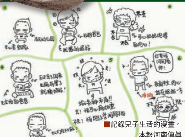
■記錄兒子生活的漫畫。