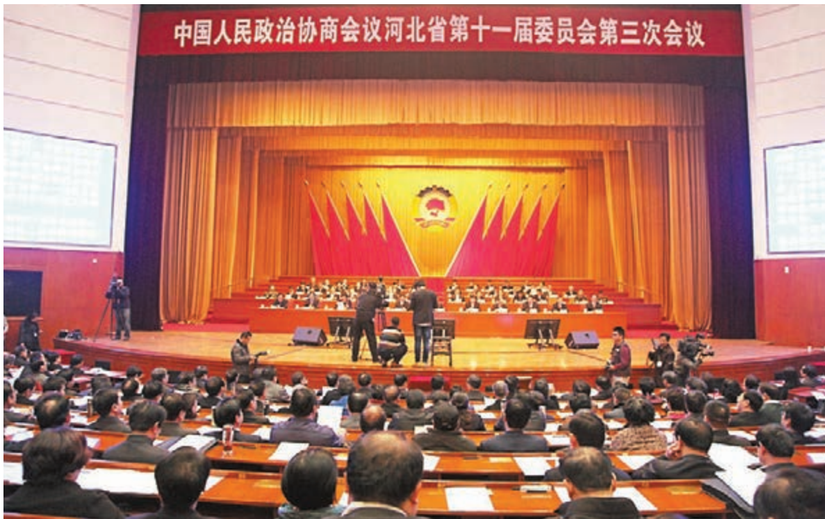
政協河北省第十一屆委員會第三次會議現場。

在河北「兩會」期間,省長張慶偉表示,2015年河北將爭創開放型經濟新優勢,鼓勵優勢企業到境外上市融資,努力提高利用外資的規模和水平。借力國家「一帶一路」戰略,推動河北優勢產業走出去,開展技術合作。鼓勵企業加大礦產資源境外投資開發力度。