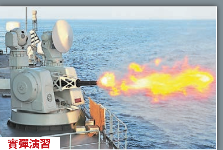
當地時間1月9日下午,中國海軍第19批護航編隊利用護航任務間隙,在亞丁灣東部海域舉行一場實彈射擊演練。圖為臨沂艦副炮射擊。

據了解,上海人春節期間看燈會已經是一項約定俗成的活動,豫園燈會作為國家級非物質文化遺產也深受遊客喜愛,曾經創下7天迎客300萬的紀錄。