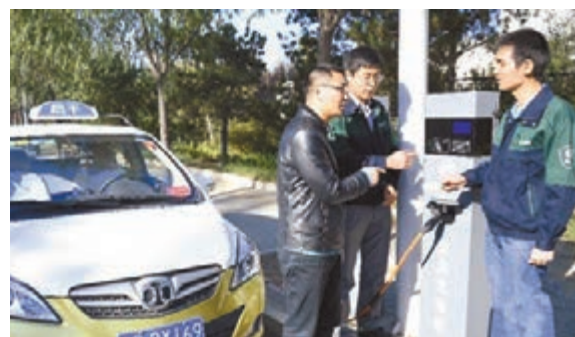
北京市已開始試點將節能路燈同時變成電動車充電樁。 網上圖片

上述負責人表示,目前北京公用充電設施建設進展明顯,正向初步在五環內建成5公里半徑快速充電網絡、日充電服務能力過萬輛的目標推進。已經在新能源汽車4S店、P+R停車場、科技園區、和高速公路服務區等場所建成純電動汽車充電樁。