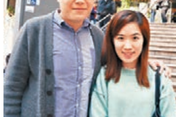
新婚的高氏夫婦指抽中猶如中六合彩。

香港文匯報訊(記者 羅繼盛)新一輪居屋申請會於今晚7時截止申請,昨日中午過後有大批市民到樂富房委會客務中心交表。有新婚夫婦希望抽到居屋,建立自己的安樂窩,亦有父親為兒子交表碰運氣。截至昨日下午5時,房委會客務中心累計收到約3.3萬份居屋申請表,超額近14倍,當中約3.2萬份是白表,以及約1,400份綠表。