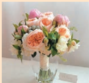
Whim 2015 春夏 婚嫁花作系列