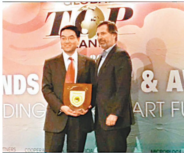
■海信ULED產品獲年度顯示技術金獎。