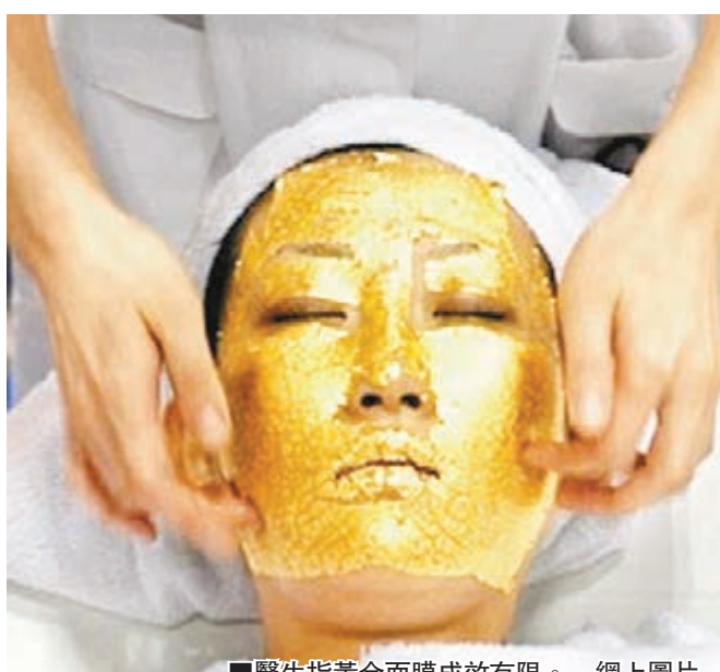
■醫生指黃金面膜成效有限。網上圖片