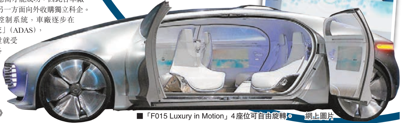
■「F015 Luxury in Motion」4座位可自由旋轉。網上圖片