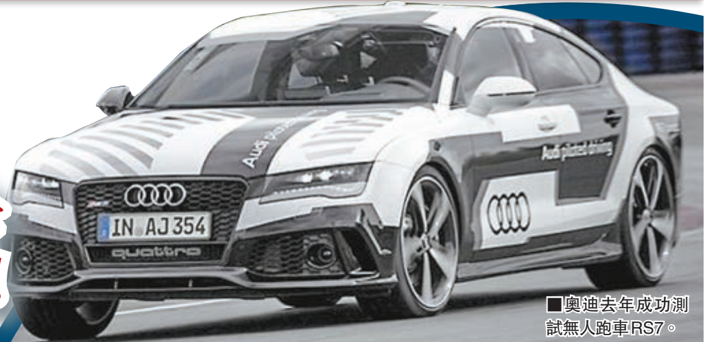
■奧迪去年成功測試無人跑車RS7。

法拉利、馬莎拉蒂、林寶堅尼……一連串名牌超跑，正受無人駕駛汽車的挑戰。隨著技術漸趨成熟，首輛無人車預料最快於2018年誕生，由於不再需要司機，開跑車的人可能愈來愈少。專家指，跑車仍有存在價值，因為其駕駛樂趣無可替代。車廠亦與時並進，把更多自動操作性能融入跑車。