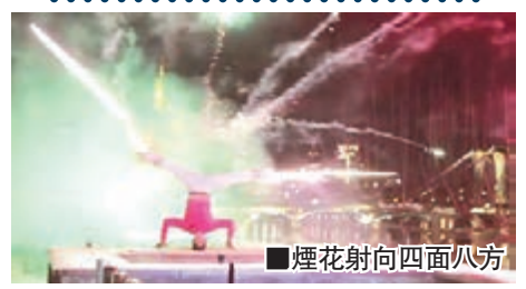
■煙花射向四面八方