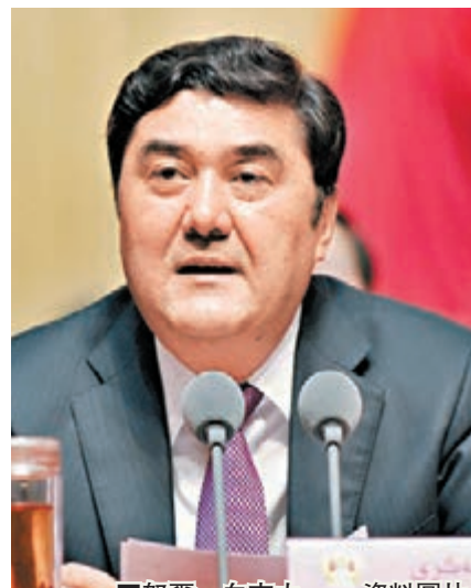
■努爾·白克力

香港文匯報訊 據發改委官網「國家發展改革委領導」欄目顯示,努爾·白克力已出任國家發改委副主任。此前,努爾·白克力任新疆維吾爾自治區黨委副書記,自治區主席。