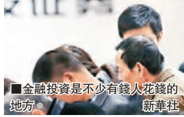
■金融投資是不少有錢人花錢的地方。

據數據總結,2014上半年,上海、北京、浙江、江蘇、廣東、天津、福建7個省市的城鎮居民收入超過了內地平均水平。而從收入數額分析,上海城鎮居民人均可支配收入最高,北京緊隨其後為21635元,浙江排名第三,達20937元。滬京浙也是內地僅有的三個人均可支配收入突破兩萬元大關的地區。