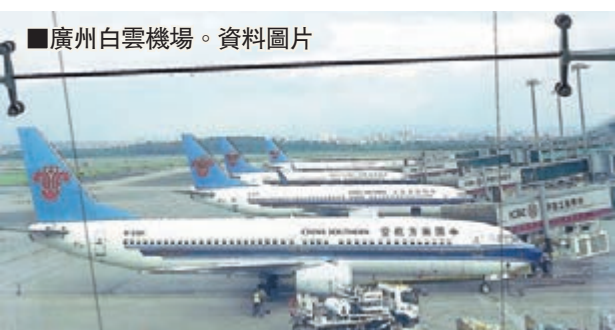
■廣州白雲機場。資料圖片

由於2月4日是中國春運首日,南航方面表示將做好航班調整工作,密切關注機場關閉與航班運行情況,將機場關閉對春運航班運行的影響降到最低。南航通告提醒廣大旅客,2月4日至5日出行的相關旅客,出行前請致電南航客服熱線95539或登錄南航官網www.csair.com以及通過南航微信查詢航班動態。