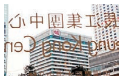
李嘉誠祝願全球超過28萬名長和同事在新的一年三羊啓泰，身體健康。

展望今年，中國將持續深化改革，為國家帶來更好的希望。美國經濟發展良好，歐洲則比較緩慢，國際油價驟然出現幾乎史無前例的暴跌，令他想起了老子的說話：「飄風不終朝，驟雨不終日。」這完全是一宗國際性事件，長遠而言，他對Husky（赫斯基）之石油業務依然充滿信心。