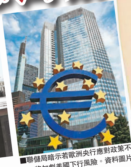
■聯儲局預測外國央行將出招，故對美國復甦具信心。