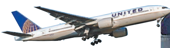
■聯合航空有13名空服員被炒。圖為聯航客機。

去年7月美國聯合航空一架原定由三藩市飛往香港的客機，被發現機尾引擎下方手繪「Bye Bye」(再見)字樣及惡魔面孔，13名機艙服務員認為有潛在安全風險，但航空公司拒絕讓所有乘客落機再進行安檢，艙服員因此拒飛，去年10月更遭解僱。他們周二向美國勞工部投訴，指遭不合理解僱，要求恢復聘用並作出賠償，航空公司表明會抗辯到底。