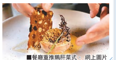
■餐廳重推鵝肝菜式。