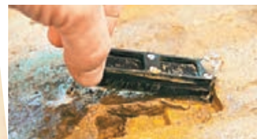
■研究人員將iChip芯片夾住細菌插入土壤，讓細菌產生抗生素。

抗生素研究出現重大突破，美國東北大學科學家聯同歐洲研究人員，利用新方法研發出新型抗生素「teixobactin」，能通過破壞細菌的細胞壁將其消滅，無需像傳統抗生素般進入細菌內部，而且有助避免產生耐藥性，可能得以解決數十年來日益嚴重的抗藥性問題。研究成果前日刊登在英國《自然》雜誌網站。