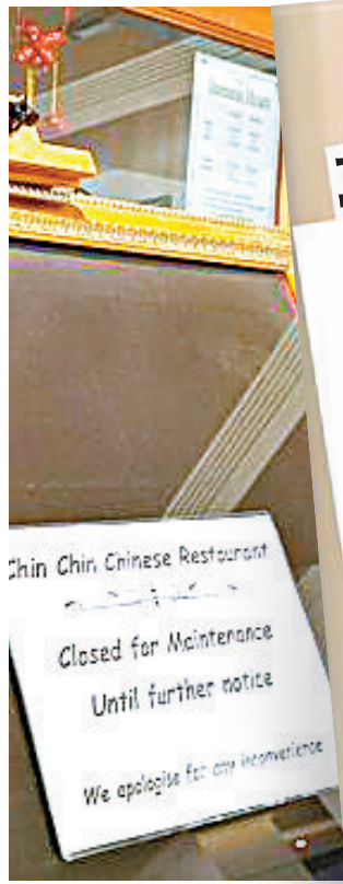
■餐館暫停營業，門外貼上告示稱維修。

澳洲布里斯班位於斯普林伍德塔酒店內的Chin Chin自助中餐館，在過去的周末有110名食客感染沙門氏菌食物中毒，出現腹瀉及脫水等症狀，約30人需住院。當局懷疑店內供應的炸雪糕是元兇，已下令餐館暫停營業，強調病源可能來自食品供應商供應的雞蛋。