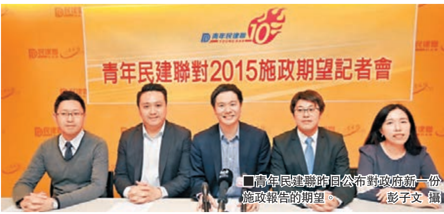
青年民建聯昨日公布對政府新一份施政報告的期望。

在教育方面，青年民建聯除了支持將中央列作必修科，增加持續進修基金額度至5萬元外，亦希望強化助學金及貸款計劃，涵蓋北上攻讀學位的本地學生，以滿足社會對學位教育的需求。另外，他們亦