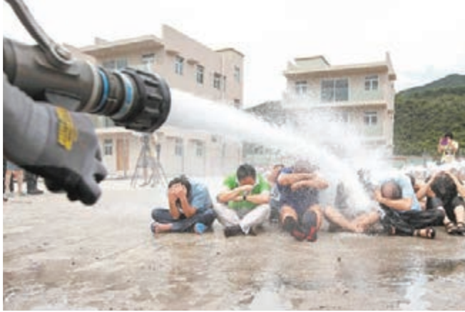
華人民主書院去年9月初在屯門大欖搞「非暴力抗爭」訓練。資料圖片