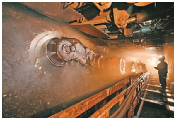
兗礦集團核心技術綜採放頂煤工藝。

據集團有關人士介紹，2014年，兗礦集團依靠科技進步實現減人提效和安全高效集約化生產，為集團貢獻了44.8億元。在煤炭生產關鍵環節，則重點實施了「六個優化」，提高原煤生產效率和勞動效率，逐步扭轉採掘生產用人多、效率低的局面。集團境內商品煤成本同比降低71.80元/噸，創下生產成本最低的歷史新紀錄。