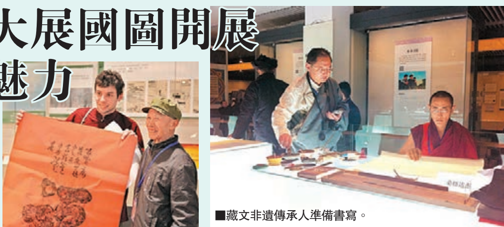
■藏文非遺傳承人準備書寫。

在一飽眼福的同時，觀眾還可以現場體驗使用中國最正宗的文房四寶——湖筆、徽墨、宣紙、歙硯等書寫文字。觀眾紛紛表示，這樣的展覽令普通民眾可以更加直觀地了解中國文字的魅力。