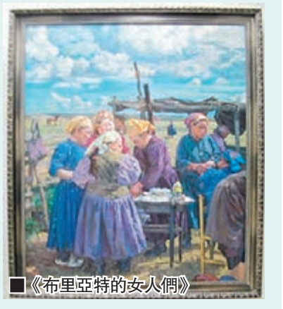
■《布里亞特的女人們》

據了解，首屆和第二屆全國少數民族美術作品展分別於1982年和2004年舉辦。時隔10年後，第三屆全國少數民族美術作品展的作品徵集範圍更廣、藝術水平更高、題材更豐富。