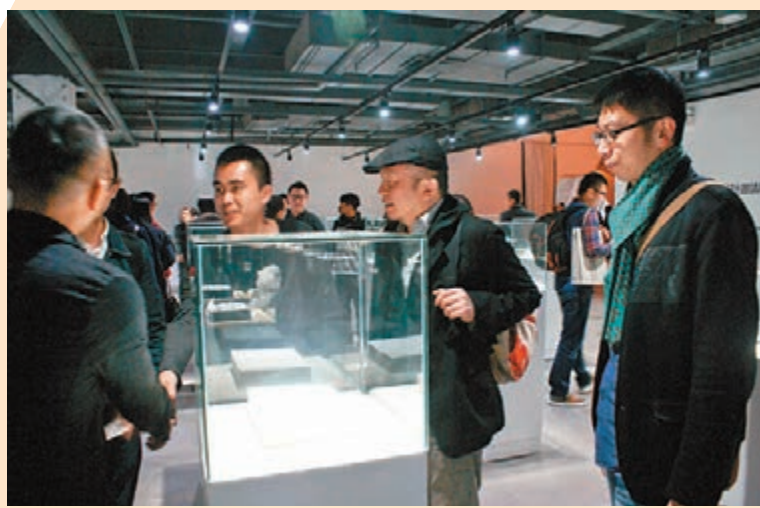
■兩岸四地的設計師們齊聚現場。