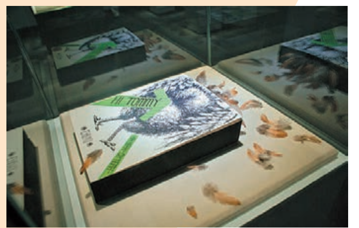
■設計歷史或重如泰山或輕如鴻毛？