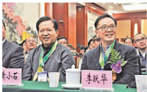
來自兩岸三地的頂尖設計大師、軟裝生產製作實力企業40餘家及雲南商界人士、從業者、大宗採購商出席峰會。

香港文匯報訊(記者丁樹勇 孔蓮芝 昆明報道)昆明日前舉辦的「軟裝在中國斗南花卉世界先鋒論壇」透露,中國軟裝產業處於快速增長期,目前年總產值已達3萬億元人民幣(下同)以上,預計至2017年可達到5萬億元左右。