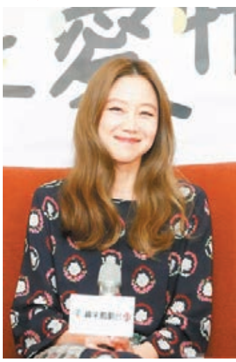
孔孝真昨天在台灣出席記者會。

有旺夫運女王之稱的孔孝真，合作過的男星都因此大紅。她從中挑選男演員車勝元為生活中的理想型，因為他最有男人味、幽默又具時尚感，但孔孝真也表示，趙寅成在《沒關係，是愛情啊！》飾演的「張宰烈」最能讓她入戲，在戲中常看到趙寅成就想流淚。