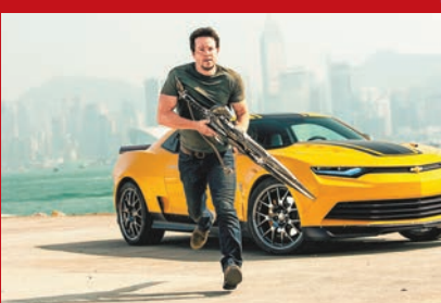
《變形金剛4》入圍最差電影。

專門揶揄一眾「爛電影」的金草莓獎還未落實入圍名單，但初選名單已於網上流出，當中黑色喜劇《奪命西》(A Million Ways to Die in the West)共有8項提名之多，認真差勁！而動作猛片《轟天猛將3》(The Expendables 3)也有6項提名，至於金美倫戴雅絲(Cameron Diaz)主演的《春光乍洩》(Sex Tape)、《Kirk Cameron's Saving Christmas》及去年於全球狂收10.8億美元(約83億港元)的《變形金剛：滅絕世紀》(Transformers: Age of Extinction)(《變形金剛4》)同得5項提名，當中包括「最差電影」。