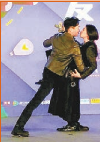
Chilam一手將靚靚抱實再來個深情一吻。

香港文匯報訊 昨日下午、北京，浙江衛視原創明星夫妻真人騷節目《一路上有你》舉行盛大開播發布會，知名製作人馬雪瑤同張智霖(Chilam)、袁詠儀(靚靚)、田亮、葉一茜、赫子銘、何潔三對明星夫婦全陣容亮相，為即將於1月10日周六晚開播的節目造勢。三對明星夫妻於現場笑稱這節目組連番「欺騙」，更即場擺出恩愛「甫士」，Chilam一手將靚靚抱實再來個深情一吻，掀起全場高潮。