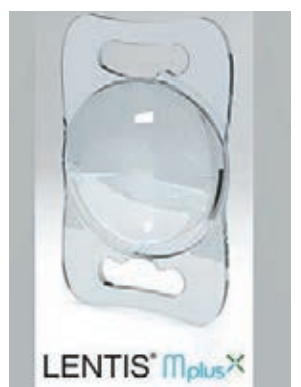
■出事的Mplus X人工晶體並未在香港及內地出售。

英國每年有12萬人接受矯視手術，大部分年過50歲的人士會選擇植入人工晶體，然而英國連鎖私人眼科中心 Optical Express 採用的一款德國人工晶體最近疑出現問題，有病人投訴植入後視力嚴重受損，提出集體訴訟。醫療衛生管理部門(MHRA)已着手調查，呼籲有疑問的病人立即向視光師或醫生查詢。本港及內地則無出售這款人工晶體。