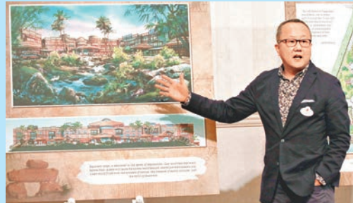
李勇表示,為新酒店設計時亦會遇到困難,包括要從眾多想法中選出最適合本地的意念。

負責為「迪士尼探索家度假酒店」進行設計的建築師,為華特迪士尼幻想工程創意總監李勇,他於迪士尼工作超過17年,曾經在美國洛杉磯、匹茲堡及東京擔任設計師及建築師,港人赴日熱點之一的東京迪士尼樂園度假區,亦由他擔任監製,負責總體規劃、構思新發展和遊樂設施。