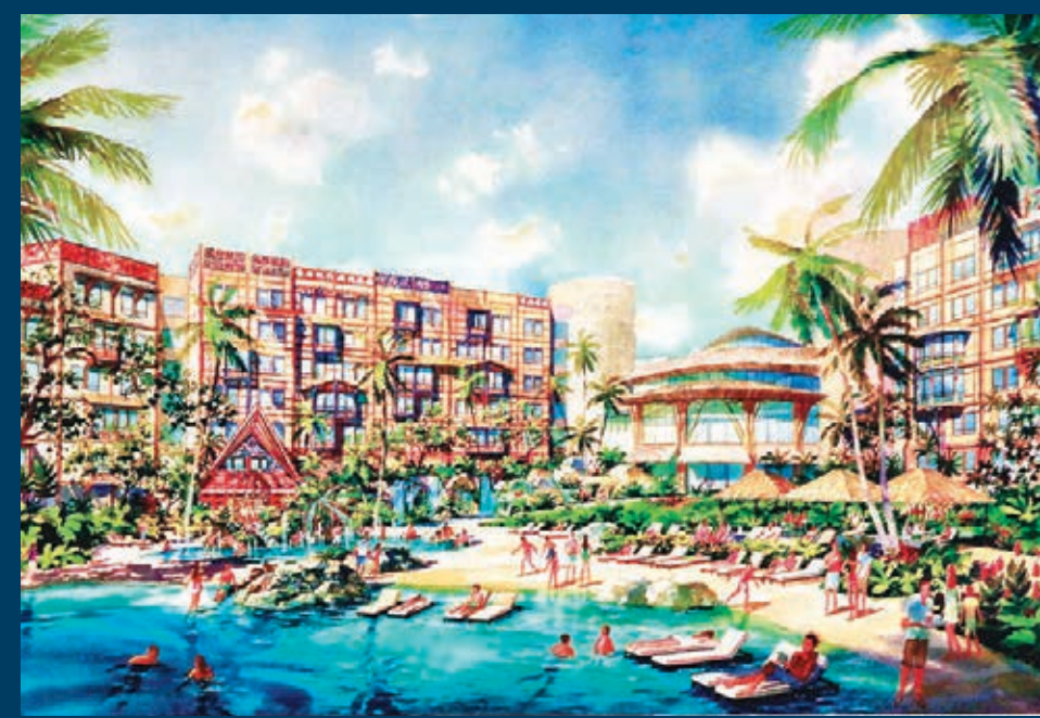
新酒店同時設有大型室外泳池,池畔旁建4個地域的特色建築,讓住客全天候置身於探索氛圍中。