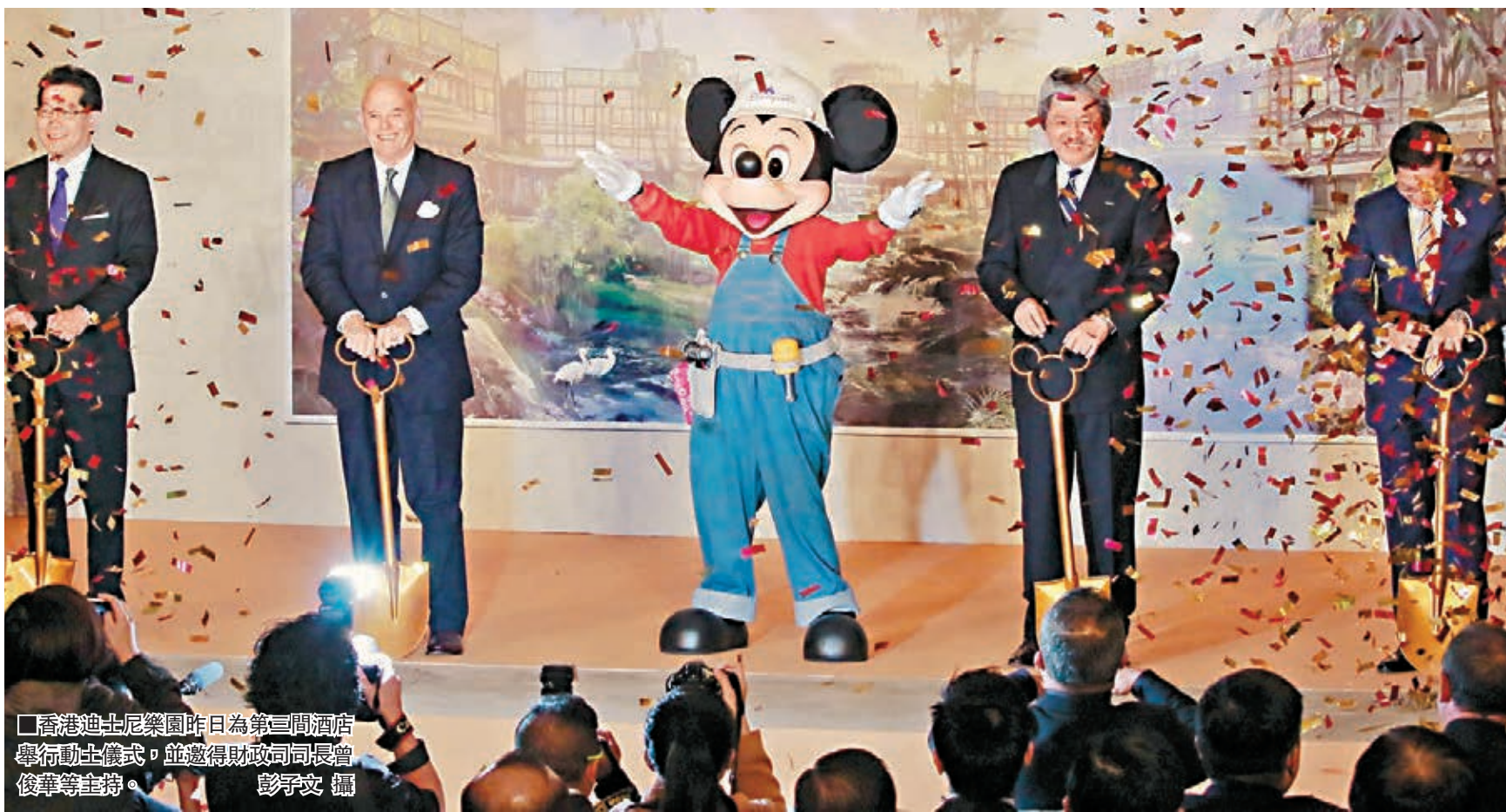
香港迪士尼樂園昨日為第三間酒店舉行動土儀式,並邀得財政局司長曾俊華等主持。

以節省22分鐘。他並強調,長遠口岸建設不能只着眼三數年,而是未來32年,保守估計經濟效益可達500億元。陳志明又透露,一份原本在去年年底到期、有關連接路工程的標書,經當局與承建商進行商討後,有效期已延至今年7月,讓政府有更多時間爭取撥款。有議員質疑合約可以隨便更改,陳志明表示,延長合約期要雙方同意才行,當中存在困難,並強調延期不代表問題解決,因通脹上升,開支會不斷增加,而且延期可能會影響工程的其他合約。陳志明亦指,有關口岸的設計和勘測在去年3月已完成,如獲財委會批准撥款,將可以在今年3月展開,預計2018年完成。