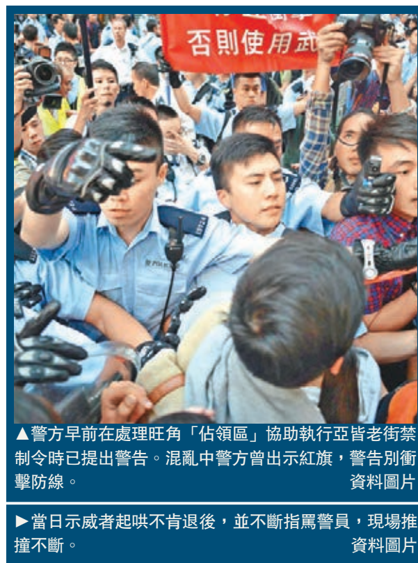
▲警方早前在處理旺角「佔領區」協助執行亞皆老街禁制令時已提出警告。混亂中警方曾出示紅旗，警告別衝擊防線。