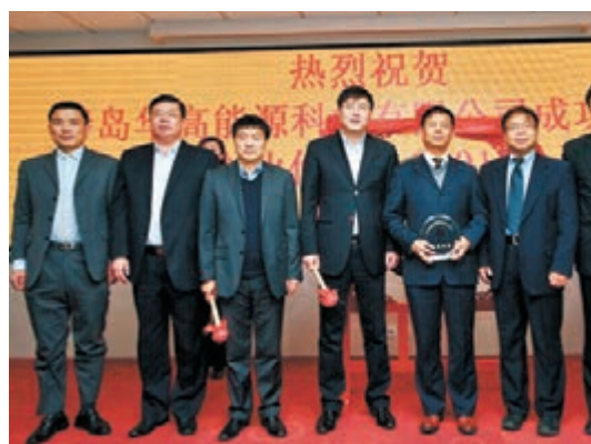
華高能源科技日前掛牌儀式。

近年來，青島高新區主動增強機遇意識，積極搶抓以石墨烯為代表的新材料產業發展先機，堅持「聚集、聚集、聚合、聚變」的推進路徑，全力打造「1+5」主導產業體系建設。依托3萬平米的石墨烯科技創新園，建設我國北方唯一的國家級示範基地-青島國家石墨烯產業創新示範基地，和全國首個國際石墨烯創新中心。同時完善石墨烯上下游產業鏈，組織搭建青島國際石墨烯交易中心，依靠專業的交易通道建設機構，為高新區石墨烯產業發展提供有力的資源保證。