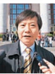
小米 CEO 雷軍 資料圖片

香港文匯報訊（記者 馬琳 李昌鴻）小米CEO雷軍昨日公布，小米2014年售出6,112萬台手機，同比增長227%，含稅收入743億元(人民幣，下同)，增長135%。6,112萬的手機銷量，完成了之前雷軍許下超過6,000萬台的銷售目標，也讓小米成為內地智能手機市場份額領先企業。