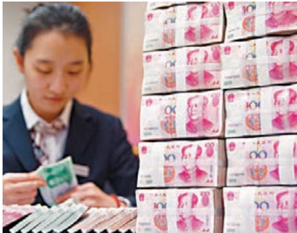
IMF今年將重新審核特別提款權（SDR），人民幣或將會被納入。

另一個IMF正面對的問題是，目前難以準確計算人民幣「自由程度」，因任何央行也不會公開自己儲備中的投資比例，使IMF難以計算人民幣在世界的流通性。Jukka Pihlman指唯一可行的解決方法，乃IMF直