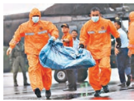
■搜索人員陸續打撈客機殘骸。美聯社

搜索亞洲航空失事QZ8501客機的工作持續，當局昨日再找到第5塊大型殘骸，尋獲遺體總數增至31具，但潛水員行動因天氣再度叫停。印尼氣象部門表示，天氣是導致客機失事的「誘發因素」。 雲層有凍雨 疑結冰損引擎 客機墜毀已超過一星期，潛水人員昨日下午，發現另一大塊機身殘骸，相信不少遇難者遺體可能在這塊大型殘骸中，不過海底布滿沙泥，能見度為零，所以只能放棄。印尼國家搜救總署署長班邦表示，將嘗試部署遙控水下載具搜索。配備特殊設備的船隻則繼續探測客機黑盒下落。 客機墜毀原因方面，印尼氣象部門稱，機師在客機處於3.2萬呎高度時請求向左偏航以躲避積雨雲，同時大幅提升 ■美聯社/新華社/法新社/路透社