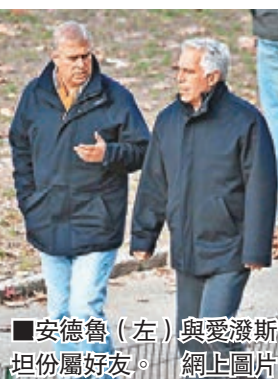
安德魯(左)與愛潑斯坦(右)屬好友。

當時美國正值1980年代經濟繁榮期，愛潑斯坦的投資獲利不菲，成為億萬富豪，更買下大量物業。他1990年代初結識吉萊納後，有機會結識多國權貴，除英國安德魯王子外，美國前總統克林頓、前副總統戈爾及以色列前總理拉伯克均曾是其私人飛機座上客，亦有出席他舉辦的奢華派對。然而在性侵犯案被揭發後，愛潑斯坦身敗名裂，朋友大都離他而去。