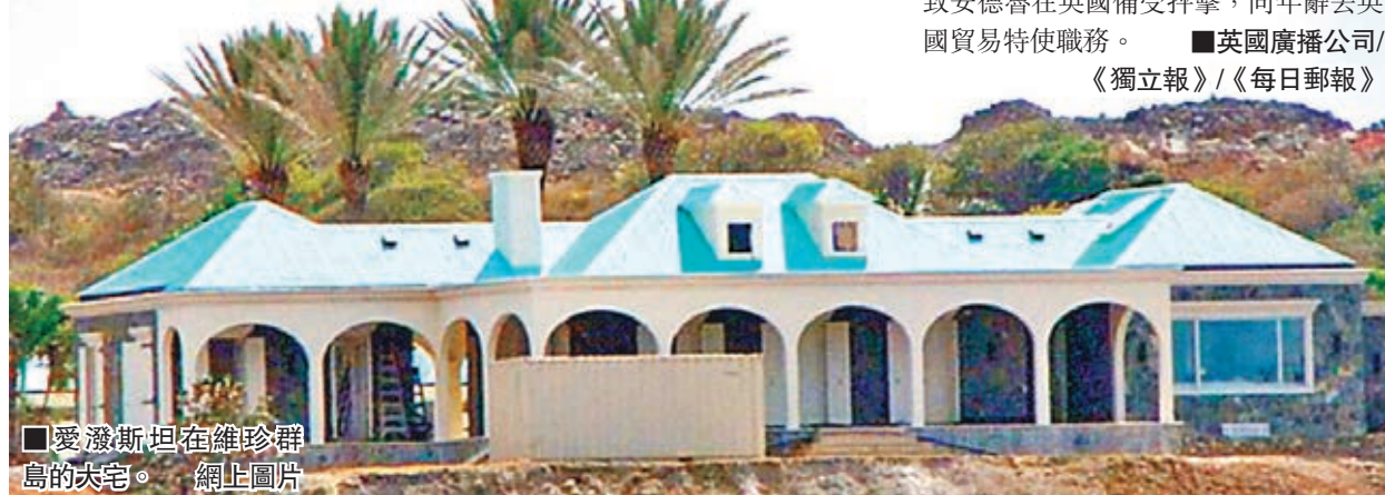
愛潑斯坦在維珍群島的大宅。