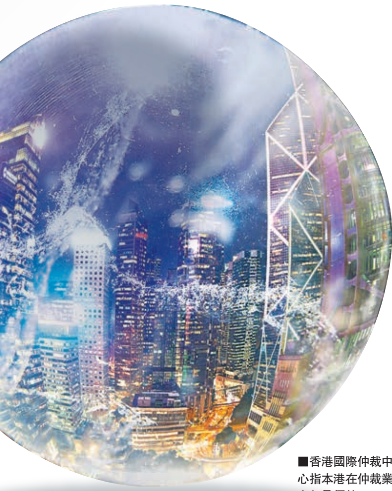
香港國際仲裁中心指本港在仲裁業上仍具優勢。