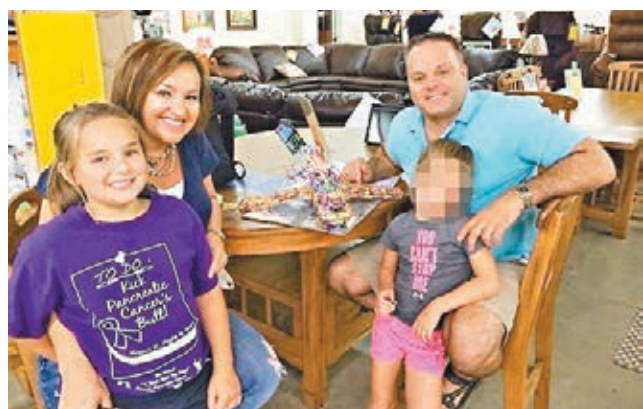
遇難女童一家，左前為女童的姐姐。

美國一架載有5人的小型飛機，前日由佛羅里達州前往伊利諾伊州期間，在肯塔基州西部失事墜毀，機上一名7歲女童自行爬出，向附近居民求救。當局接報到場發現飛機殘骸，證實其餘4人已罹難。