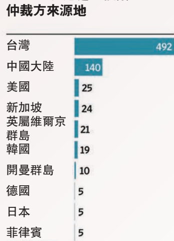
2013年香港處理個案的仲裁方來源地