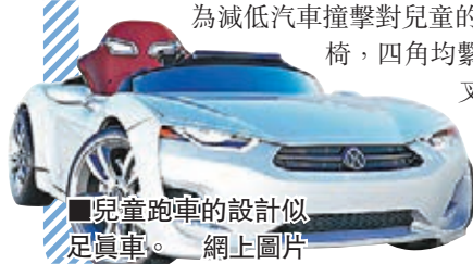
兒童跑車的設計似足真車。網上圖片