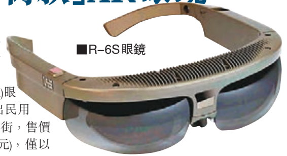
圖文加入實境 輕拍框邊操控

美國軍事科技公司Osterhout Design Group(ODG)過去6年斥巨額研發多款軍用「擴增實境」(Augmented Reality, AR)眼鏡。公司計劃今年中推出民用版本，讓用家隨時戴着行街，售價約1,000美元(約7,756港元)，僅以往的1/5。