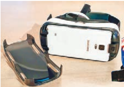
下載Milk app的Note 3(右圖)可插入VR頭盔(左圖)作屏幕。