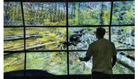
■屏幕系統VuePod。網上圖片

美國猶他州楊百翰大學土木及環境工程系最近研發可探測地形的虛擬實境屏幕系統VuePod，利用裝有激光雷達的飛行裝置掃描地形，將數據轉為圖片，再由12部55吋高清大電視組成的巨