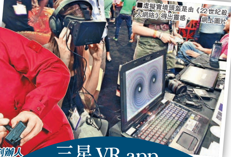
虛擬實境頭盔是由《22世紀殺人網絡》得出靈感。