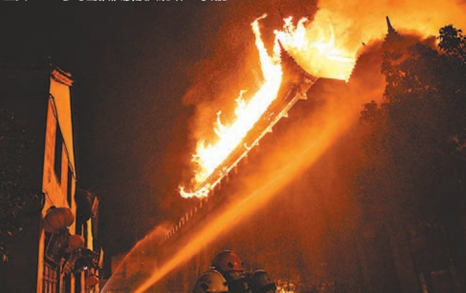
大理600多年的拱辰樓被火燒毀。

據了解，國家文物局工作人員今日將抵達巍山，了解拱辰樓火災情況，準備下一步拱辰樓恢復重建工作。