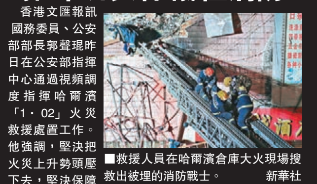
救援人員在哈爾濱倉庫大火現場搜救出被埋的消防戰士。