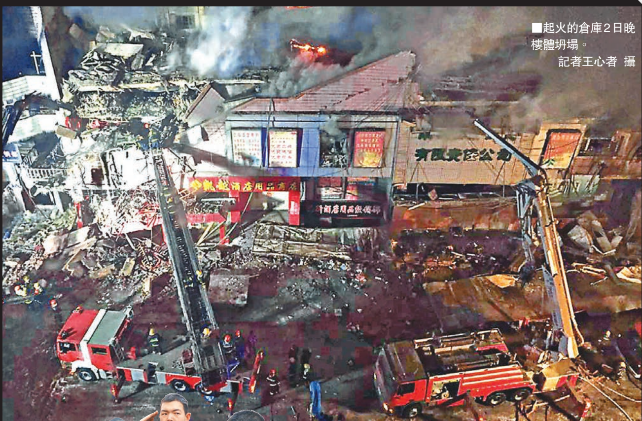
起火的倉庫2日晚樓體坍塌。