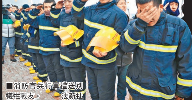
消防官兵行軍禮送別犧牲戰友。