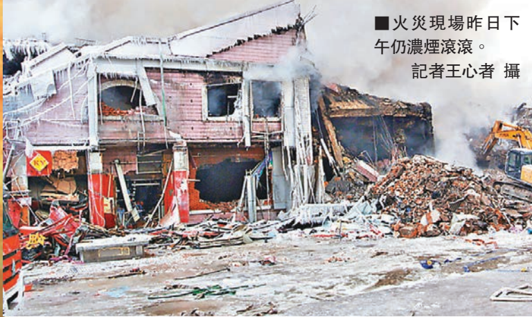
火災現場昨日下午仍濃煙滾滾。

專家分析稱,火勢之所以持續時間較長,主要是地下一層、地上一至三層全部為倉庫,庫內沒有隔離牆,存放大量易燃物品,周邊消防通道不暢,房屋密集,滅火救災難以到達有效位置。鉤機等大型設備已進入現場作業,力爭在較短時間內全部撲滅殘火。