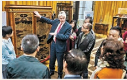
香港文匯報訊（記者 寧寧 廣州報導）「鑒金歲月—十九世紀歐洲頂級古董傢俱珍品鑒賞會」日前亮相中國廣州東方文德藝術品交易中心。據稱，此次展品不同於以往的傢俱展覽，這些來自英國、意大利、法國等的百餘件傢俱精品及貴重飾物中，許多作品達到了博物館藏品的級別，有的甚至是稀世珍寶。歐洲傢俱藝術史家、鑒賞家克里斯多夫·佩恩在現場對展品進行甄別和鑒定。